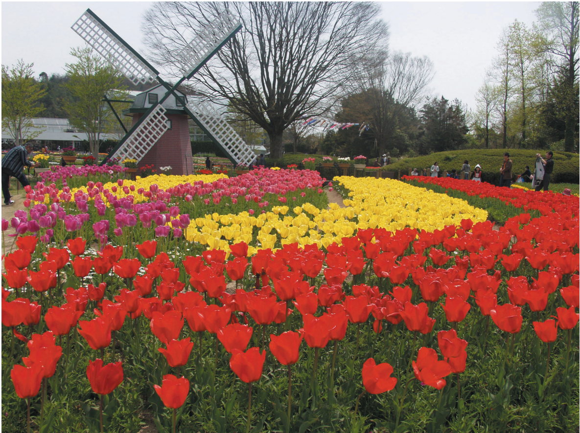
リニューアルした兵庫県立フラワーセンター