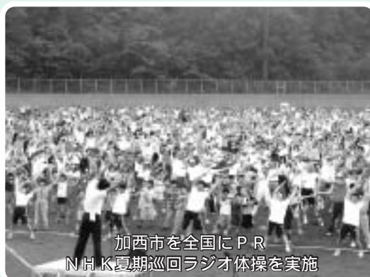
加西市を全国にPR NHK夏期巡回ラジオ体操を実施