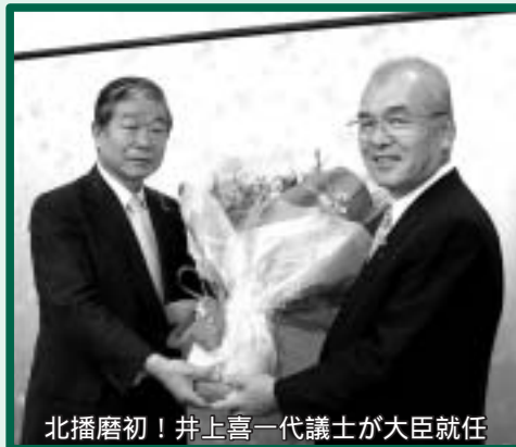
北播磨初！井上喜一代議士が大臣就任