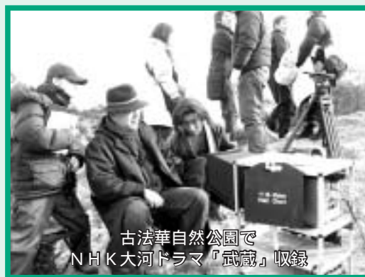
古法華自然公園で NHK大河ドラマ「武蔵」収録