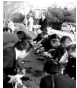
参加者全員による「すいせん」の植え込み

病院増改築工事が10月末完成し、11月7日（金）に加西市、病院、市議会、工事関係者の出席で、「竣工記念植樹」を行いました。病院中央館1階待合いホールでの「記念式」では、