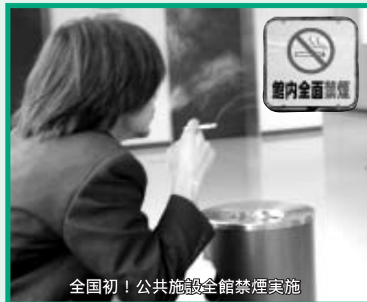
全国初！公共施設全館禁煙実施