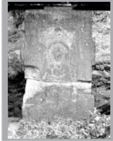
市指定文化財 春岡寺石仏(池上町)