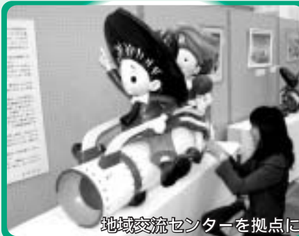
地域交流センターを拠点に市民主体のまちづくりが本格化