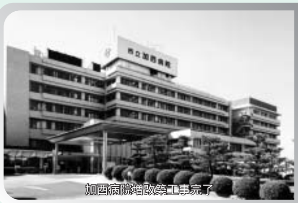
加西病院増改築工事完了