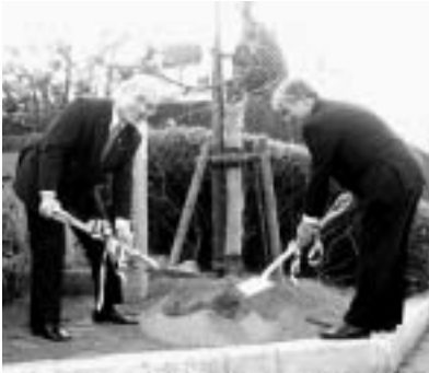
柏原市長と森田厚生委員長による「しだれ桜」の植樹