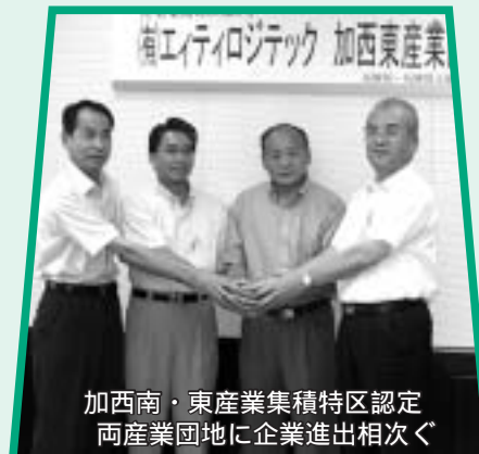
加西南・東産業集積特区認定 両産業団地に企業進出相次ぐ