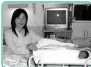
母児同室のお母さんと赤ちゃんです。

時間制限されることなく、赤ちゃんに何度も授乳を繰り返すことがよい刺激となり、母乳の分泌がよくなる