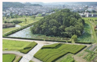
◀根日女が眠る玉丘古墳