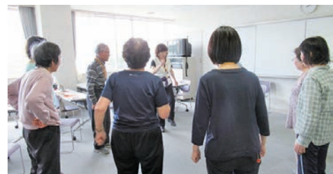
昨年の脳トレ教室の様子

2つの課題(身体を動かす+頭をつかうなど)を同時に行うトレーニングや楽しいゲームに取り組み、脳の活性化を目指す教室です(全8回)。併せて、認知症についての講話も実施します。教室仲間でワイワイ、笑顔で脳の若返りを目指しましょう！