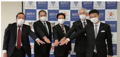
複合商業施設出店決定。3者でまちづくり協定締結

中 野町上山地区（九会小学校西側）に複合商業施設の出店が決定し、5月19日加西市役所で記者発表を行いました。中野町自治会、加西市、民間事業者（ジオプランナーズ株式会社）でまちづくり協定を締結し、地域の核となる商業施設の誘致に向けて3者協働で取り組みを進めてきました。平成30年9月に「中野町まちづくり協議会」が発足され、10月に市も大規模な商業施設の建築を可能とする都市計画変更をしました。協議会は、まちづくり構想図の作成やため池廃止など問題解決のために計9回開催され、商業施設誘致の強力な推進役となりました。商業施設は令和3年春頃オープン予定です。