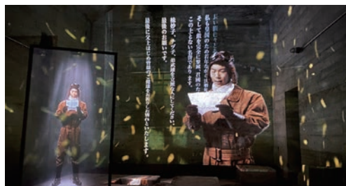
巨大防空壕で上映される映像

鷓 野飛行場跡地には第2次世界大戦末期、姫路海軍航空隊があり、特別攻撃隊「白鷺隊（はくろたい）」が編成され、63名が散華されました。飛行場跡地周辺に残る貴重な戦争遺跡の一つである巨大防空壕の内部空間を活用し、CGをまじえた映像による白鷺隊員の遺書の公開を6月21日より開始しました。公開日時：毎月第1、第3日曜日（各日4回） 定員：各回20名まで（事前予約制）