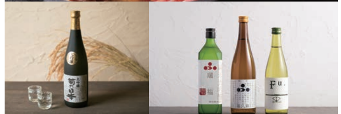
加西市特産品 (ねひめビーフ、日本酒)