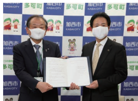
吉田町長(左)と西村市長(右)

また、アプリも「加西・多可健幸アプリ」に変更され、アプリに登録されている特定の場所を訪れることでポイントが付与されるチェックイン機能が新たに追加されました。また、イオンと連携したポイント事業も6月1日からスタートしており、2月28日まで実施します。今後は更に北播磨広域定住自立圏での事業を広げて活性化を図っていきます。