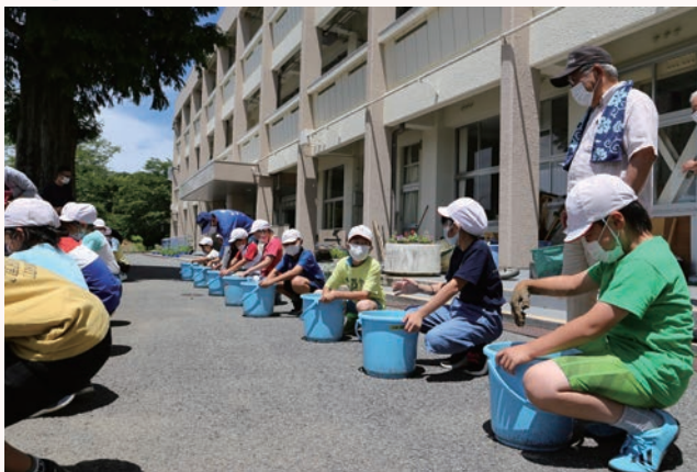
▲自分たちのバケツに苗を植える児童たち

賀茂小学校4年生が総合的な学習の時間に田んぼに見立てたバケツを利用して地域特産の紫黒米の栽培に取り組みました。賀茂地区ふるさと創造会議の皆さんから米の品種の特徴、各作業の役割など説明を受けたあと、各自のバケツに植え付けをしました。また、キヌヒカリなど他の品種の栽培も同時に行い、紫黒米の特徴を今後観察していきます。