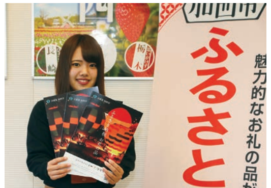
魅力的な返礼品をご用意しています