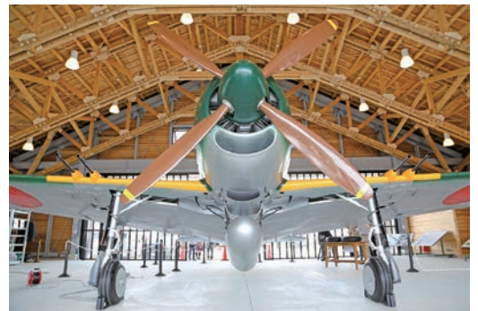
紫電改の実物大レプリカも公開