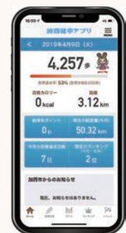
加西健康アプリホーム画面