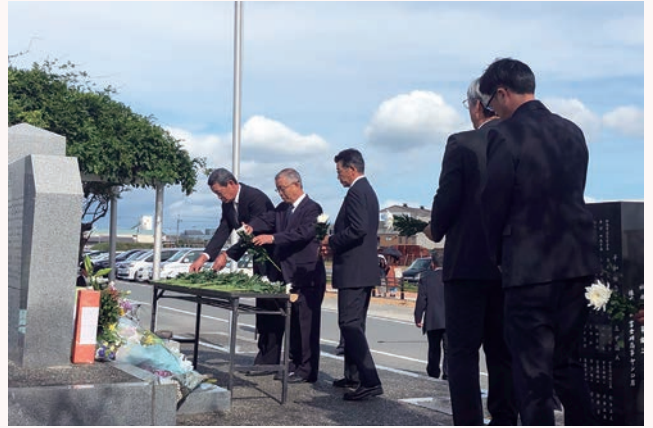
▲参加者による献花

旧海軍の鵜野飛行場跡地（鵜野町）にある鵜野平和祈念碑前で第 21 回平和の祈念祭が行われました（主催：鵜野平和祈念の碑苑保存会）。天候にも恵まれ、地元住民や遺族関係者ら 150 名が参加。全員での黙とう、高校生が特別攻撃隊員の遺書を朗読、参加者全員による献花などが行われ、戦没者を慰霊するとともに平和への祈りをささげました。