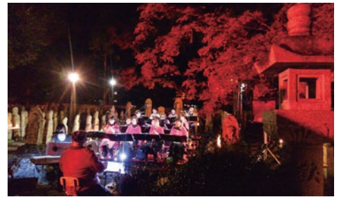
幻想的な雰囲気で行われるミニコンサート