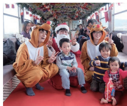
列車内でサンタ・トナカイと記念撮影