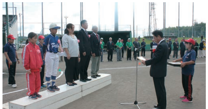
アラジンスタジアムでの表彰式