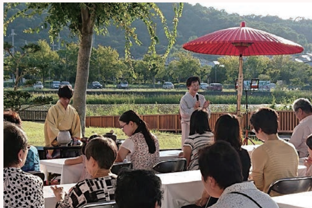
▲茶の湯について説明を受けられる参加者

加西市茶道協会主催の観月茶会が健康福祉会館で開催されました。表千家の藤原宗愛社中により野だてを行い、30 分ごと 8 回行った全ての回が満席となり、350 名の方が、お琴の演奏を聞きながら、茶の湯のわびさびを感じられました。天候にも恵まれ、1 年のうちでひととき美しいと言われる中秋の名月をめどることができました。