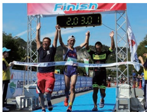
リレー1位のイーナカサイのゴール