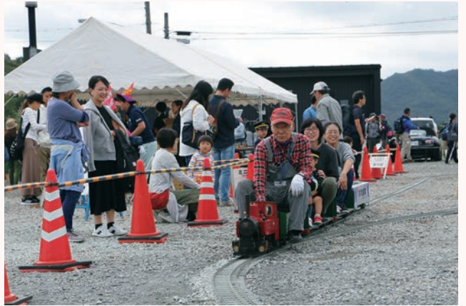
▲恒例のミニ SL は子どもたちに大人気

北条鉄道は、鉄道の日（10月27日）に播磨横田駅前西横田町農村公園で北条鉄道まつりを開催しました。事前の予報では天候が心配されていましたが、無事晴れて約 400 人の来場者が鉄道の日を楽しみました。ミニ SL やプラレール、お絵描き教室、各駅スタンプラリーなどの子供向けの催しは大盛況。ミニ SL に乗った子どもたちが、楽しそうに来場者に手を振っていました。