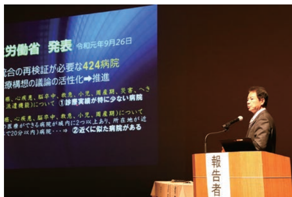
加西病院の取り組みを報告する西村市長

当日は、約 450 名の皆さまの参加があり、各所属から 7 名の部長が、それぞれの部での取り組みをはじめ、加西インター産業団地整備計画、施設の統廃合による効率化・広域化などさまざまな分野の取組状況を発表しました。最後に西村市長より「市立加西病院検討から導き出される未来への選択」と題し、加西病院を取り巻く環境と今後の取り組みについて報告をしました。