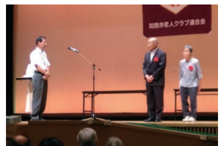
健康福祉会館での表彰式

いくつになっても自分の歯でおいしく食事が食べられるように「毎日の歯磨き習慣」「定期的な歯科健診」「しっかりかむ習慣」を心がけましょう。