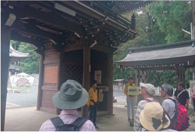
▲ガイドする「宇仁っ子ふるさとガイド隊」

宇仁っ子ふるさとガイド隊 11 名によるガイドハイキングが行われました。八王子神社（田谷町）と鏡山古墳を子どもたちが元気に案内。参加者は「みんなハキハキとしゃべっていて聞きやすかった」「ガイドの際、地名をパネルに書いていて見やすかった」と大満足。子供たちからたくさんの元気をもらって、笑顔のあふれるハイキングになりました。