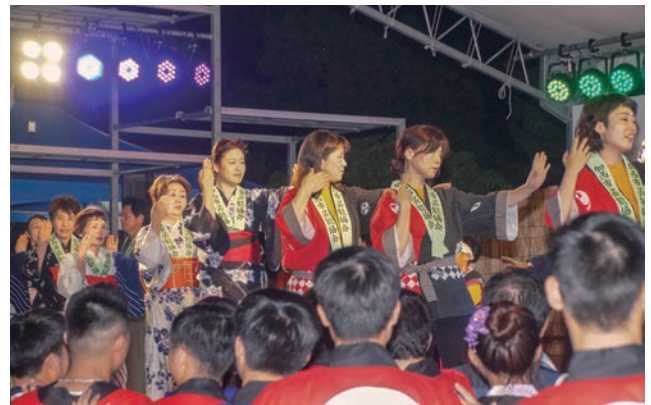
会場が一体となった昨年の総踊り