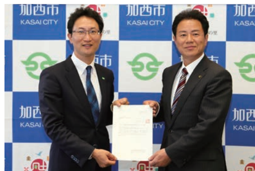
加西インター産業団地優先交渉事業者決定記者会見 第1号優先交渉事業者がリスパック(株)に決定

また、将来を展望した加西インター産業団地は、整備事業を力強く加速するとともに、製造業と農業のバランスの取れた働き方に対応した雇用創出にも取り組みます。