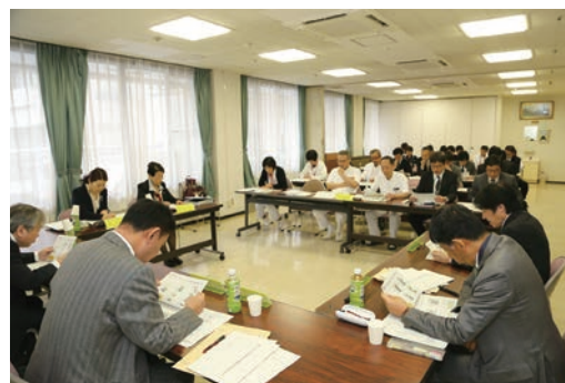
加西病院将来構想検討委員会の様子

また、ふるさと納税をはじめ市の収入確保に努め、具体的な施策の実行財源として活用しながら、地域創生の強力な推進に努めてまいります。