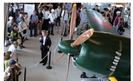
上谷さんの解説を聞く来場者