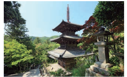
日本遺産に認定された法華山一乗寺

1300年つづく日本の終活の旅～西国三十三所観音巡礼～として、第二六番札所になっている法華山一乗寺が日本遺産に登録されました。一乗寺は、白雉元年（650年）創建の大変古い寺院です。境内には平安時代末期、承安元年（1171年）に建立された国宝三重の塔をはじめ、聖徳太子及天台高僧像十幅（国宝）など文化財が多数あります。これを機会にぜひご参拝ください。