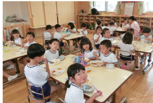
給食を楽しむ園児たち(加西こども園)

教育環境の充実としては、老朽化の進んでいる南部給食センターの新築など残されたハード面の整備に加え、英語やICT教育の充実をはじめとするソフト面の充実を進め、総合的な教育環境の整備を推進します。