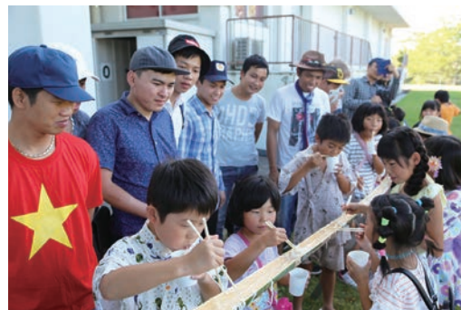
NPO法人ねひめカレッジによる国際交流夏祭り

「住みよさ」を高めるため、子育て支援の充実、公共交通の利便性向上、県内で初めて署名した「世界首長誓約」に基づく環境対策、増加する外国人住民との多文化共生自治体を目指した拠点施設や日本語学校の設置など、魅力ある加西市をつくり、人口増加に向け挑戦していきます。