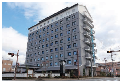
昨年12月に開業したホテルルートイン加西北条の宿

また、「ホテルルートイン加西 北条の宿」の開業による北条旧市街地周辺でのにぎわいをもたらす取り組みを進めるほか、鶉野飛行場跡周辺の整備や熱気球等を活用し、まちの活性化と定住促進につなげていきます。地域の魅力をさらに磨くとともにシティプロモーションに積極的に取り組みます。