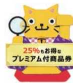
公式キャラクター カクニャン

※子育て世帯で対象となる方には、9 月中旬に世帯主宛てに引換券を送付します。申請は不要です。