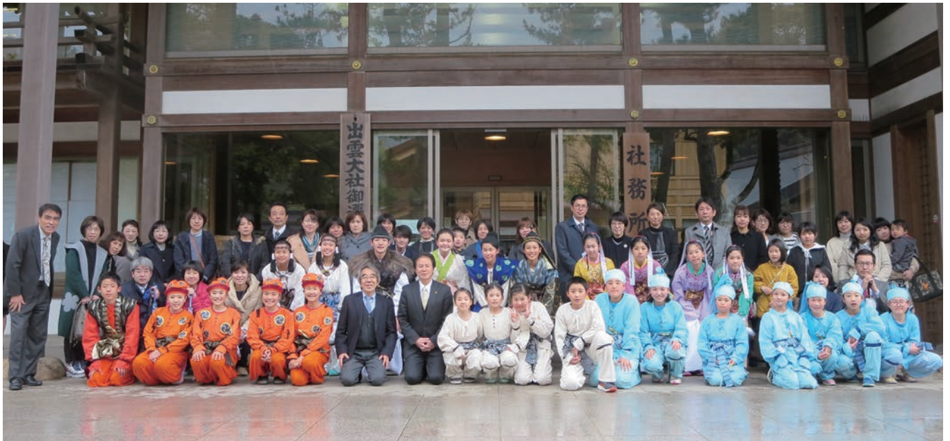
▲出雲大社社務所前で集合写真