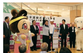
昨年のオープニングセレモニー