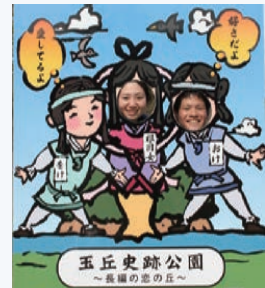
顔出しパネル「長編の恋の丘」

根日女物語は、約1500年前から現在にまで語り継がれる恋物語であるため「長編の恋の丘」と題しました。根日女や2皇子のようにお互いに思い続けることができるよう恋人同士や家族等で撮影してください。