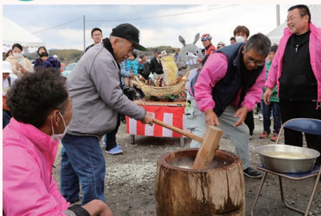
▲今回は餅つきも行われ、つくたてのお餅が振る舞われました。

北条鉄道は、沿線の桜を楽しんでもらおうと、播磨横田駅前西横田農村公園で「さくらまつり」を開催しました。当日は、良い天気にも恵まれ約600人の来場者が、ミニSLやたくさんのお店が立ち並んだ播磨横田駅前でお祭りムードを楽しみました。このたびは、餅つきや北条鉄道と旧車「ミゼット」が並んで走るイベントも実施され、大いににぎわいました。