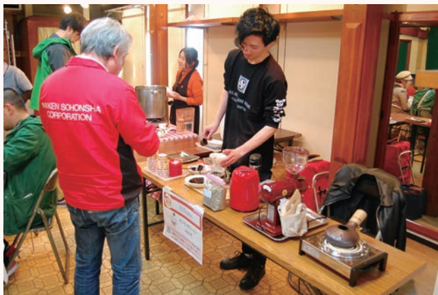
▲空き店舗でこだわりメニューを提供

北条地区の御旅筋周辺で、北条旧市街地元気なまち再生事業の一環として、昨秋に続き「イチガタツ〜北条食の市」が北条を食べる会主催により開催されました。当日は、空き店舗の軒先などを借り、飲食の起業希望者など 9 店が出店しました。食以外にもまき割り・炊飯体験、おだし講座など楽しめる内容を充実させ、前回とは一味違ったイベントとなりました。