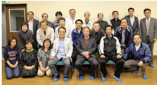
日吉地区ふるさと創造会議の皆さん

活動拠点となる旧日吉幼稚園跡を、子どもからお年寄りまでが気軽に集まれる地域の「たまり場」にしたい。そして、安心して住める、愛着の持てる、お年寄りが元気で暮らせる、日吉地区を夢見ています。