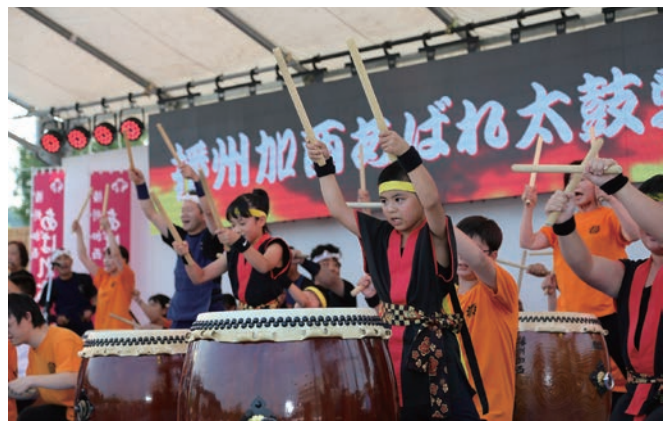
ステージパフォーマンス