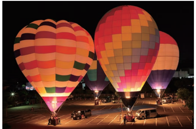
昨年のバルーングロー