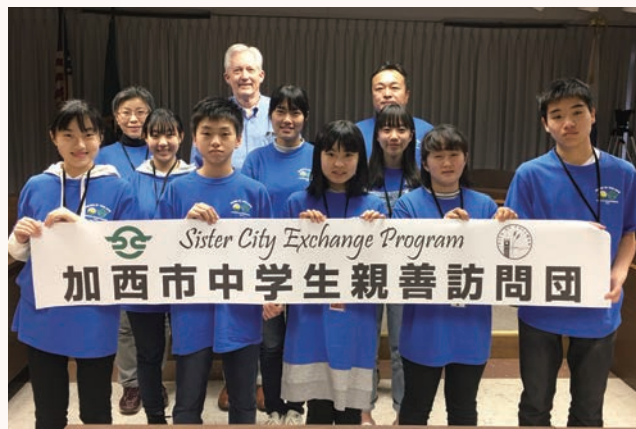
▲プルマン市ジョンソン市長を訪問

3月23日（土）～4月1日（月）に、中学生親善訪問団 8 名がプルマン市を訪問し、ジョンソン市長やホストファミリーの歓迎を受けホームステイをしました。リンカーン中学校では、加西の魅力や日本文化を伝えるプレゼンを実施。また、実際に授業を受けるなど充実した日々を過ごしました。この訪問でアメリカの文化・生活に触れ、素晴らしい体験が出来ました。