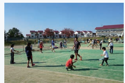
昨年のテニススクールの様子

申 込 先 ：文化・観光・スポーツ課 ☎④2 8773 fax ④2 8745 bunka@city.kasai.lg.jp