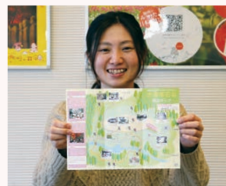
古法華石仏周辺マップ

古法華寺周辺には多くの石仏が立っています。訪れた人が快適に石仏巡りができるように「古法華石仏周辺マップ」を作成しました。国の重要文化財である日本最古の石仏や四国八十八カ所巡りなどの情報も記載しています。パンフレットは古法華寺に常設しているほか、観光案内所や北条鉄道各駅にもあります。