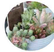
多肉植物寄せ植え