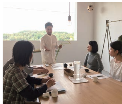
▲前回のプログラム「稲見会」