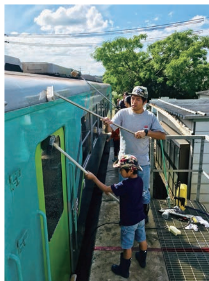
▲前回のプログラム「北条鉄道の洗車」