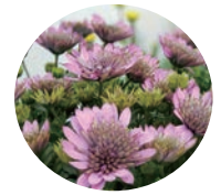
オステオスペルマム