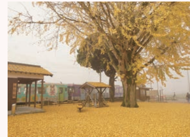
幻想的な大イチョウの落葉

兵庫県景観形成重要樹木に指定された大イチョウのそばに記念看板を設置しました。大イチョウは高さ約 21 m、秋には落葉で辺り一面を黄色に染める網引駅前のシンボルです。この場所は、景観を維持するために地域の皆さんが毎年イチョウの落ち葉を清掃され、住民の憩いの場にもなっています。