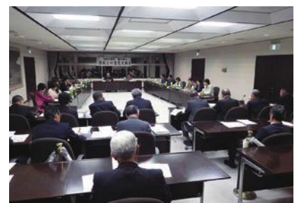
市民との意見交換会

結びに、市民の皆さまにとりまして今年一年が幸多き、素晴らしい年となりますよう心からお祈り申し上げます、新年のご挨拶といたします。