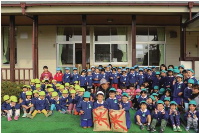
▲寄贈されたお米を囲んでハイポーズ（北条東こども園）

地元のお米を食べてもらおうと、市内の認定農業者で結成する「アスリートファーマーズ加西（AFK）」が、市内の認定こども園や幼稚園、保育園に今秋収穫した玄米420Kgを寄贈しました。子供たちは大きな米袋を抱えながら、元気な声で「ありがとう」と感謝の気持ちを伝え、それぞれの園で「新米月間」や「おにぎりの日」として給食でおいしくいただきました。