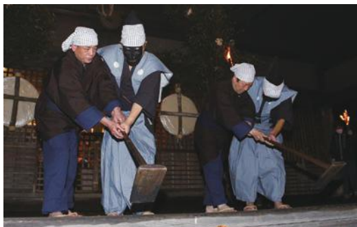
農作業のしぐさを奉納します(田遊び)