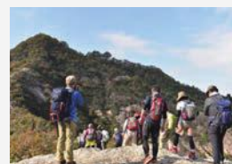
好日山荘の登山ツアー

下里地区を代表する地域資源である善防山の整備を積極的に進めています。毎月 2 回、草刈機などの道具を担いで登っています。東櫓登山口のルートや烏帽子岩へのルートなど新ルートも開拓しました。また、頂上の木々を伐採したので、見晴らしがよくなりました。アウトドア専門店の好日山荘のツアーにもしてもらい、市外の登山者も増えています。山で出会う登山者達からの「ご苦労さま」という言葉が私たちの活動の源になっています。