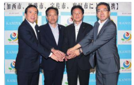
7月28日に宇佐市、鹿屋市、姫路市と「空がつなぐまち・ひとづくり推進協議会」を設立

結びに、市政への一層のご理解とご協力をお願い申し上げ、皆さまのご健勝とご多幸を心から祈念申し上げます、新年のご挨拶といたします。