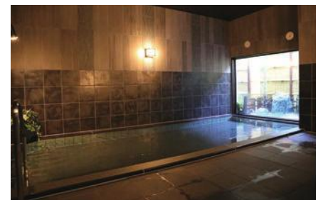
ラジウム人工温泉大浴場「旅人の湯」