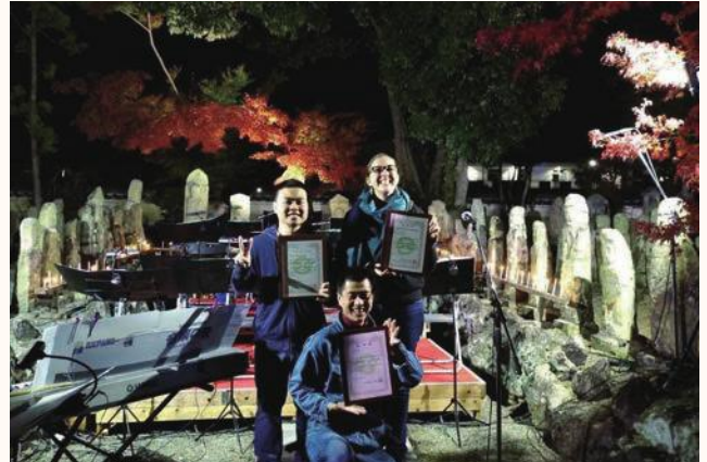
▲加西市観光アンバサダーの3人（五百羅漢にて）

市内に在住在勤の外国人から見た加西の魅力やまちの情報を、多言語で発信していく観光アンバサダー事業を開始しました。ベトナム語、英語、中国語に対応しています。加西の魅力たっぷりの情報を随時アップしますので、市内にお住まいの外国人の方も楽しみください。Facebook、Instagram、wechat（ウィチャット）で情報発信しています。