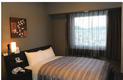
客室（コンフォートシングル）