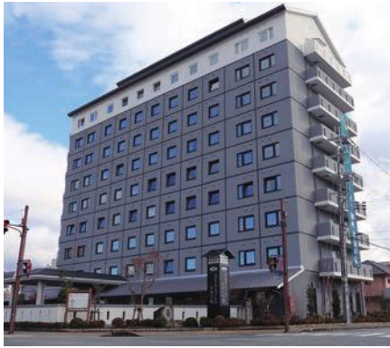
ホテルルートイン加西北条の宿 外観

問合せ先／産業振興課 ☎42-8740 fax43-1802 sangyo@city.kasai.lg.jp