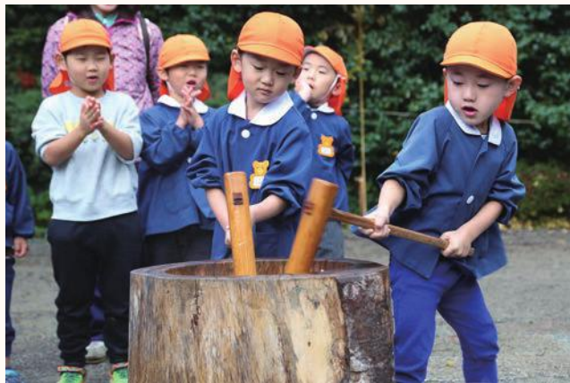
▲お餅つきをする園児