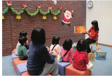
読み聞かせの様子