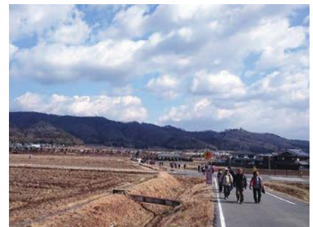
昨年のロマンの里ウォーキング

KASAI データバンク 人口／44,535 (-26) | 男／21,782 (-9) | 女／22,753 (-17) | 世帯数／18,020 (+13) H30.11.29 現在(前月比) 11月の出生数／23人 死亡数／52人 ●1/9、23は市民課・国保医療課窓口を延長(17:15～19:00)