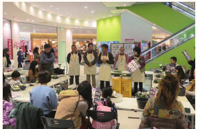
▲ハボタンの産地などをPR

12月15日と16日に、神戸市垂水区の「ブルメール舞多聞」において、全国有数の産地である加西市産ハボタンをPRしました。