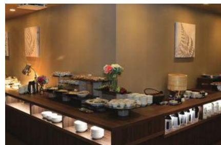
レストラン（ビュッフェコーナー）