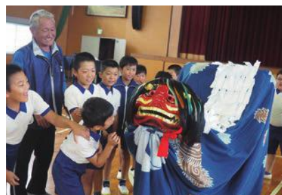
獅子舞とのふれあい