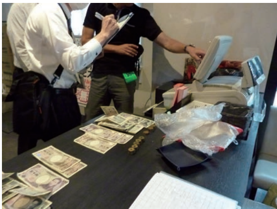
兵庫県と合同で営業店舗を強制搜索

さらに、本年度は兵庫県から「個人住民税等整理回収チーム」の派遣を受け、滞納整理の強化を図っており、不誠実な滞納者に対して滞納処分を実施しています。