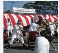
第 4 回在田・出会い・触れあいフェスティバル

今年、4 回目となる「在田・出会い・触れあいフェスティバル」には、700 人以上の方に来ていただきました。泉子ども太鼓や太鼓振興会の演奏のほか、けん玉チャンピオンにも参加いただき、世代を超えて楽しむことができました。また来場者全員での玉入れは圧巻でした。会場でふるまう恒例の「あいあいカレー」は皆さんの楽しみとなっています。