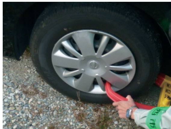
タイヤロックによる差押