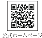
公式ホームページ