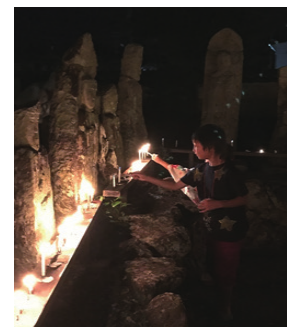
羅漢像の前で火をともし子ども

千灯会には、600人を超える入場者があり、住職による法要、市民活動団体によるミニコンサート、焼き鳥やかき氷、わた菓子といったお店も出店しました。子どもから大人まで楽しんでいただき会場は大変にぎわいました。また、境内では約1千本のろうそくに火がともされ、ろうそくの明かりに照らされた459体の石仏がぼんやりと暗闇に浮かぶ幻想的な雰囲気堪能しました。