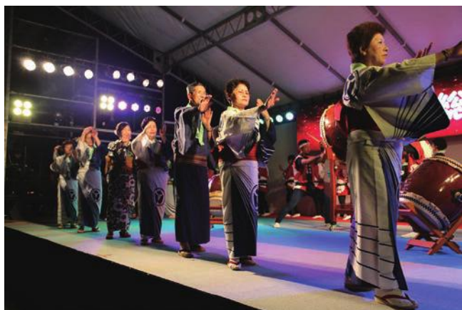
芸能協会の音頭で、会場が一体となった加西音頭総踊り