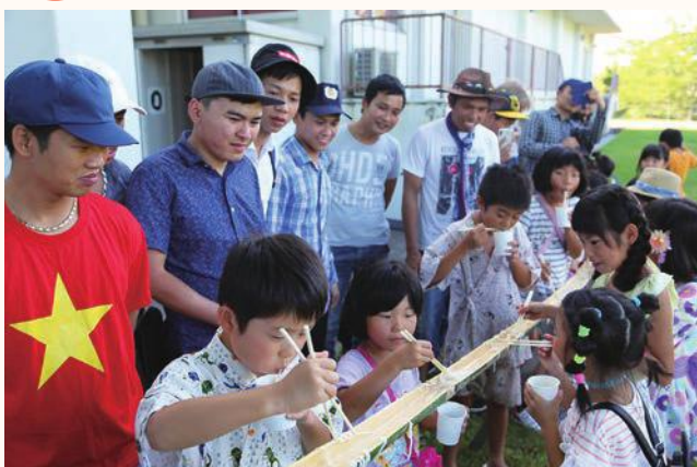
▲初めて見る流しそうめんに興味津々な参加者たち

NPO 法人ねひめカレッジ（加西市国際交流協会）主催の国際交流夏祭り「なつのゆうべ」が善防公民館で開催され、ベトナム、中国、アメリカなど 9 カ国から 80 名が参加。会場には特設の流しそうめん台が設置され、日本子どもたちが食べるのを興味津々な様子で見られていました。参加した外国人は、スーパーボールすくいなど日本の縁日文化を楽しみました。