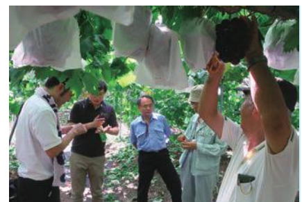
流通事業者と意見を交わす生産者

近年、加西市では、新規就農により多数の若者が、ぶどう作りに取り組んでおり、大都市近郊の産地として注目されています。7月31日には流通事業者が特産化を目指すブラックビートの園地視察に訪れ、生産者と意見交換を行いました。