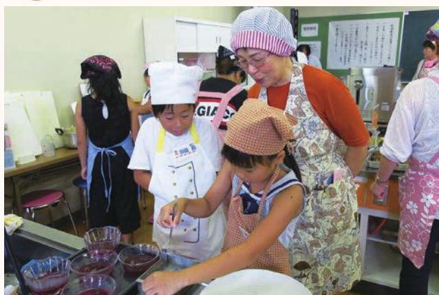
▲加西ゴールデンベリー A を使ったゼリーを作る子どもたち

加西市農村女性組織連絡協議会が主催する「親子料理教室」が市民会館で行われ、10 組 22 名の親子が参加しました。