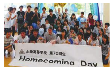
参加者で記念撮影

北条高校同窓会（柏葉会）が8月11日、今春同校を卒業した生徒を対象に、メンタルケアや旧友との絆を深めてもらおうと「Home Coming Day」を校内で開催されました。第70回生の生徒や学年団の先生などが参加し、旧交を温めたりスピーチ大会を行ったりしました。卒業して数カ月、一回り大きくなった卒業生の姿がありました。