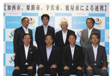
7月28日鹿屋市にて設立総会を開催

第二次世界大戦時に、川西航空機工場に大きな空襲被害を受けた姫路市、訓練飛行場が特攻基地になった加西市・大分県宇佐市、特攻撃地があった鹿児島県鹿屋市の、当時空でつながっていた旧海軍飛行場ゆかりの自治体や観光関係団体および地域活動団体が、「空がつなぐまち・ひとづくり推進協議会」を設立しました。現在の平和が尊い犠牲の礎にあることを後世に伝えていくとともに、平和をテーマとした文化・観光振興、地域の活性化を目的としています。今後は、空がつなぐ交流活動の輪を広げるために、さまざまな事業に共同で取り組んでいきます。