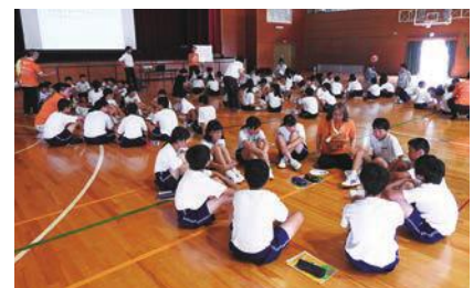
自分たちのできることを考える生徒

7月13日、加西中学校で、認知症サポーター養成講座が開催されました。講師は、研修を修了し登録されている「キャラバン・メイト」らが務めました。参加した1年生と教諭ら83人は、スライドやグループワークを通じ、認知症の症状や認知症の方・家族の気持ちを学び、認知症への理解を深めました。