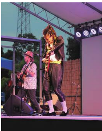
ピアノカの魔術師の演奏（前夜祭）

また、気球を行燈に見立てた「バルーングロー」では、音楽に合わせて光る気球に大きな歓声があがりました。フィナーレは、大迫力の花火が加西の夜空を彩り、約25,000人で埋め尽くされた会場は大いににぎわいました。