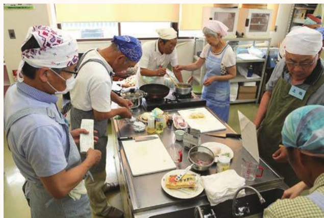
▲熱心に料理をするメンズカレッジ受講生の皆さん

南部公民館主催のメンズカレッジが、6月～3月にかけて開校されています。「趣味探求コース」と「クッキングコース」の2コースがあり、隔月で実施されています。先生の説明を熱心に聞かれたあと、受講生の皆さんは実際に野菜を切ったり、炒めたりと、先生のアドバイスを受けながら、楽しく調理されました。11月には、パンづくりにも挑戦されます。