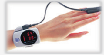
パルスオキシメータ

で、検査費用は 3 割負担の方で 300 円です。それ以外に、指先に加え鼻に呼吸のセンサーを付け、血液中の酸素・