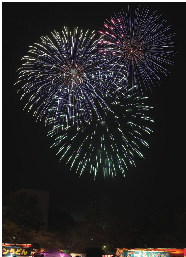
迫力のある花火が加西の夜空を彩る