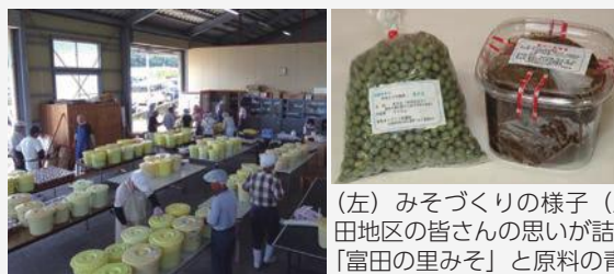
(左) みそづくりの様子 (上) 富田地区の皆さんの思いが詰まった「富田の里みそ」と原料の青大豆。