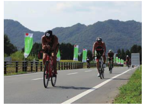
昨年のトライアスロンの様子