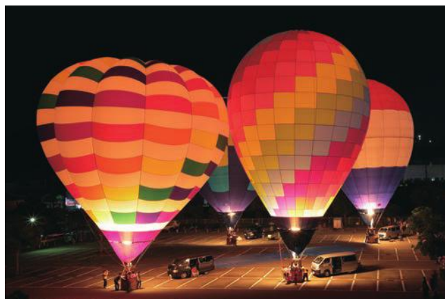
幻想的な雰囲気 연출したバルーングロー