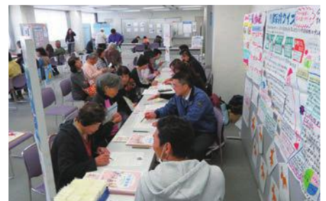
介護保険クイズなどをする参加者