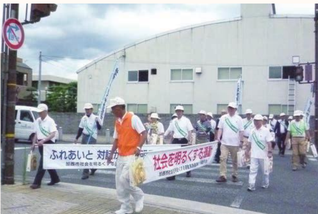
▲キャンペーン用品を配りながら啓発活動をする参加者

犯罪や非行をした人たちの再犯・再非行を無くし、「あやまち」からの立ち直りを支える地域をつくろうと、保護司会加西分区や更生保護女性会、地区推進委員、市などが、「社会を明るくする運動」を行いました。参加した約120名は、犯罪や非行のない社会を築いていくことを呼びかけました。会場では、愛の光こども園児による太鼓演奏もあり和やかな雰囲気になりました。