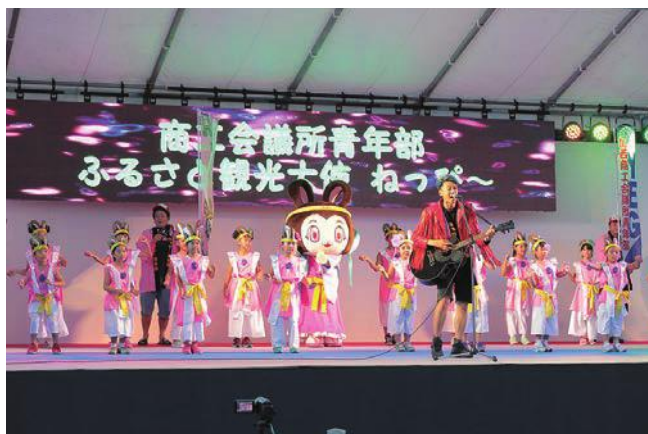
子どもたちが元気いっぱいになっぴ〜ダンスを披露