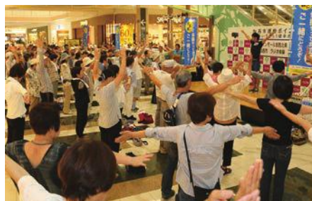
ラジオ体操をする参加者

イオンモール加西北条では、8月1日から毎日10時にラジオ体操第一を館内放送し、来場者等にラジオ体操を勧めています。また、毎週水曜日(お盆、年末年始除く)には、同2階コスモコート等で加西市スポーツ推進委員等による正しいラジオ体操の指導も行っています。