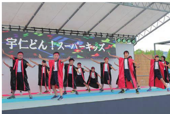
宇仁どん！スーパーキッズによるステージパフォーマンス