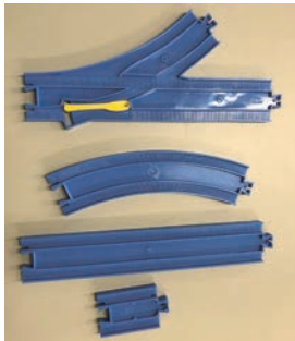
▲プラレールのパーツ

レールパーティーで使うプラレールを寄贈してくださる方を募集しています。プラレールがたくさんあるほど、イベントの楽しさも膨らみます。家に眠っているプラレールを寄贈していただけませんか？