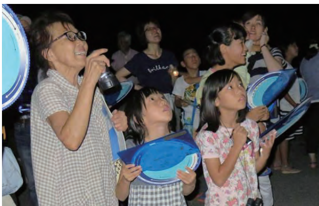
▲九会地区ふるさと創造会議／星座観察会