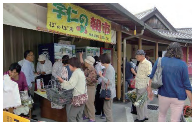
▲宇仁郷まちづくり協議会／朝市