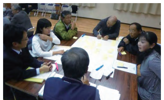
▲賀茂地区ふるさと創造会議／マチホメ大会

空き家・少子高齢化・自然環境保護等の課題は、地域によって異なります。このような課題やニーズを地域住民や既存団体、事業者等が連携し、効果的に対応できる仕組みづくりが必要となってきています。女性や若者、高齢者などさまざまな世代の知識や能力を結集し、住民参加の促進により、「こんなまちにしたい」という想いを実現できるまちづくりを目指しています。