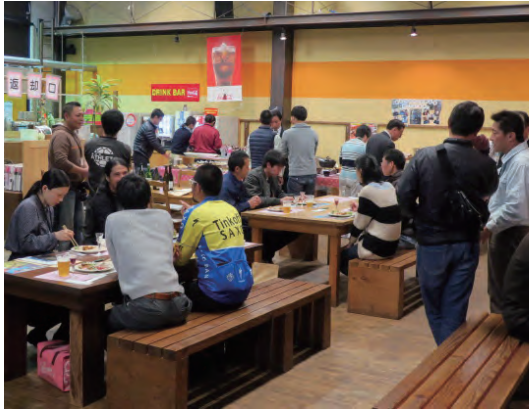
▲会場のええもん王国に集まった生産者たち

て懇談を行いました。経営者からは、将来を見据えた取り組みや課題解決のための方策など、さまざまな提案があり、これまで交流の無かった横のつながりができる契機となりました。