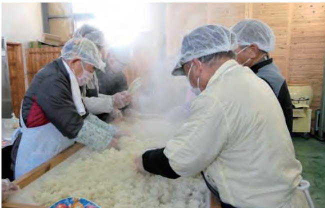
▲富田まちづくり協議会／味噌づくり