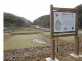
鴨坂(オークタウン加西)にある風土記看板