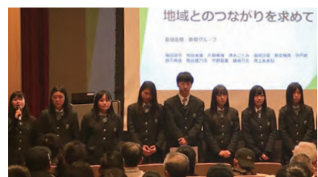
学習の成果を発表する生徒

生徒は、「まちづくり」「実用英語」「医療・教育」「科学実験」「あびき湿原の保全」のテーマに分かれて2年間活動。中学生や市民ら約100人の前で、「探究活動を通して地域と関わり、地域を知ることができた」などと発表しました。