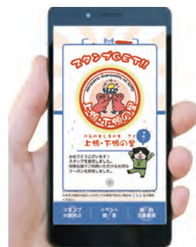
スタンプ取得画面イメージ