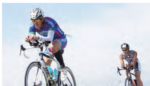
スイム・バイク・ランと過酷なレースに挑む選手

■問合せ／グリーンパークトライアスロン in 加西実行委員会事務局 (文化・観光・スポーツ課内) ☎42-8773