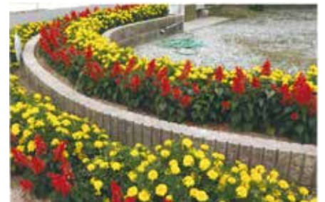
西笠原町老人クラブの花壇（サルビア）