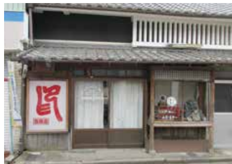
改修中の旧柏原春陽堂

地域住民の憩いの場、子どもたちの遊び場、観光案内や来訪者との交流の場として活用する地域の多世代のたまり場。また、講座やセミナーの開催などにも利用できる学びの場を兼ねたコミュニティスペースを目指しています。