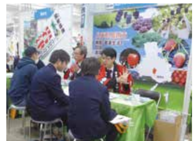
新・農業人フェアで就農相談を行う市職員

1月27日には、全国から自治体や農業法人などが集まる「新・農業人フェア」(大阪会場)に初出展し、来場者に就農支援策のPRと就農相談を行いました。