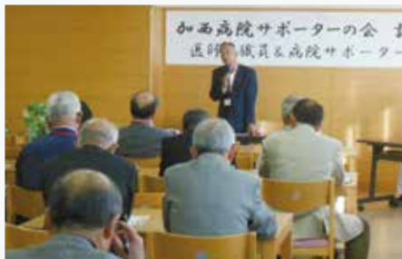
加西病院サポーターの会の設立総会

一人一人のサポーターが、できることを応援しようと会員を募っており、市民のほか、加西病院で診療を受けた市外の方など、現在330人の会員がおります。