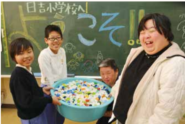
▲善防園の方にキャップを手渡す児童

日吉小学校の4年生19人が、福祉学習の一環として、ペットボトルキャップ58,321個を集め、善防園を通じて被災地支援を行いました。4年生が全校生に呼びかけ、保護者や日吉幼稚園など多くの方の協力を得ました。