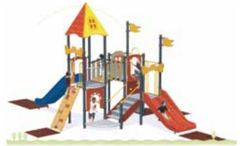
グランドキャッスルのイメージ図