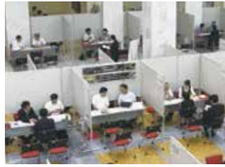
企業ごとに個別面談・説明

加西市には、高度な技術力でグローバルに活躍するモノづくり企業などが多数あります。このような市内企業の人事採用担当者と面談ができる合同就職面接相談・企業説明会を開催します。事前申込や参加費は不要です。