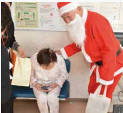
会員がサンタクロースの着ぐるみを着て、入院患者さんを慰問