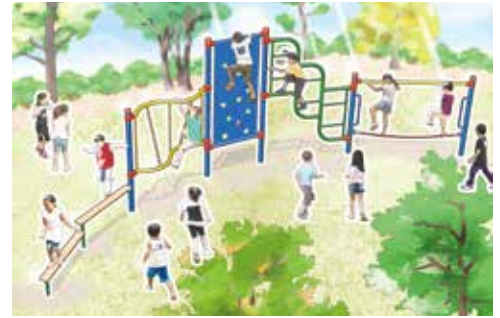
忍者ウォールのイメージ図