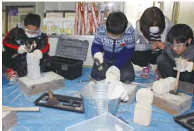
▲完成作品は3月12日まで五百羅漢境内ギャラリーで展示

北条東小学校の5・6年生10人が、クラブ活動（年間10回）で石仏彫りに挑戦しています。