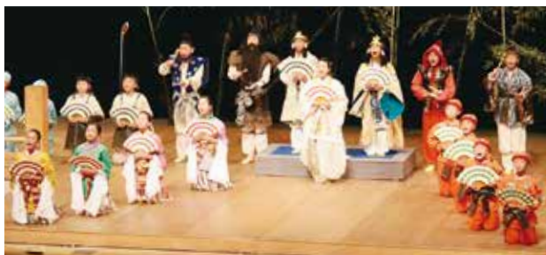
新作狂言『根日女』を演じるこども狂言塾の塾生