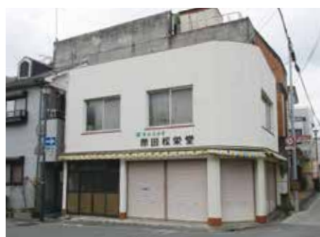
改修中の旧原田松栄堂

地域の特産物などを使った飲食店や菓子製造・販売のシェアキッチン（共同利用型店舗）として起業の場を目指します。また、料理教室などのレンタルキッチンや地域住民のフリースペースとして提供することも予定しています。