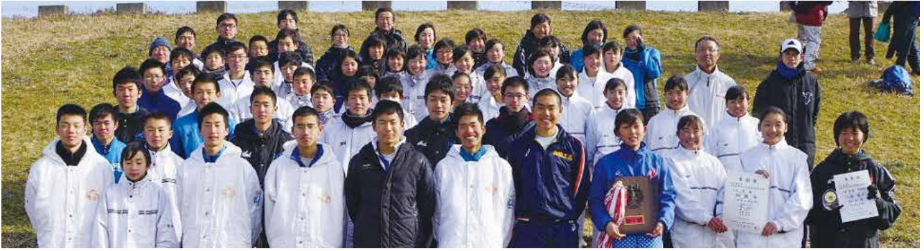
▲加西市チームの皆さん