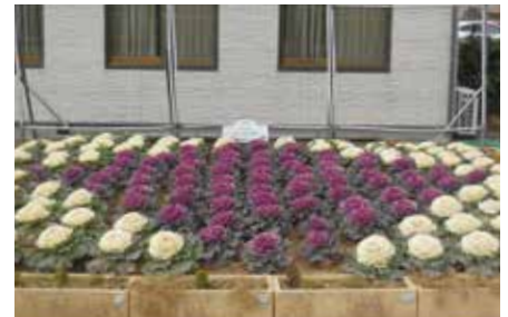
鶉野中町老人クラブの花壇（葉ボタン）