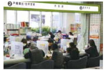
市役所の市民課窓口

今後も財政状況の改善を図るため、引き続き人件費の適正化に取り組んでいきます。詳しくは、市ホームページをご覧ください。