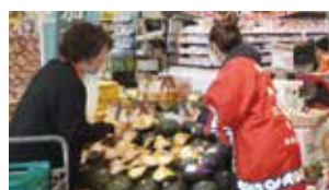
多くの商品が並んだ試食販売会

生産者が丹精込めて作り、今年は収穫量が増えました。また、16 日にはかさい愛菜館でも試食販売を行いました。