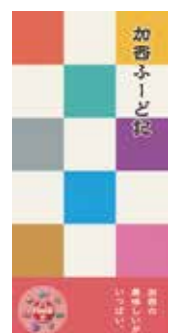
加西ふーど記のガイド本