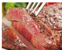
兵庫県産但馬牛ステーキ