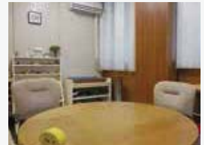
面談などを行う心理室

「病を抱えて生きていくこと」について、心理士独自の眼差しを持って支援に携わり、おひとりおひとりが生きやすさを増していくよう役割を果たしていきます。