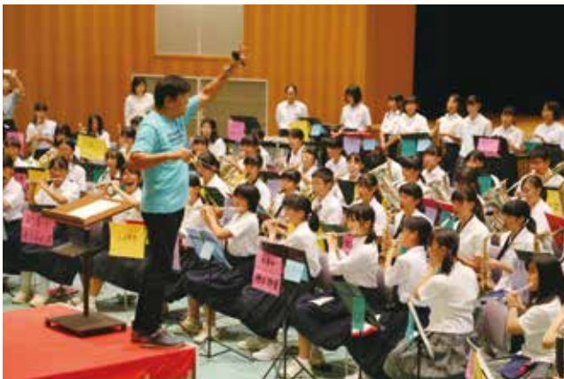
▲熱のこもった指導をする佐渡さん

世界的な指揮者の佐渡裕さんが指導する「プラスバンドクリニック」（明日来の会主催）が健康福祉会館で行われ、市内4中学校と北条高校の吹奏楽部員約110人が参加しました。