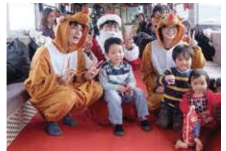
列車内でサンタ・トナカイと記念撮影