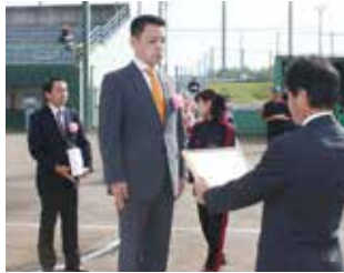
かしの木賞の表彰

10月1日にアラジンスタジアムで開催された「加西市体育大会開会式」で、スポーツ分野で優れた成績を収められた方や、スポーツを通じて青少年の健全育成に貢献された方などが表彰されました。