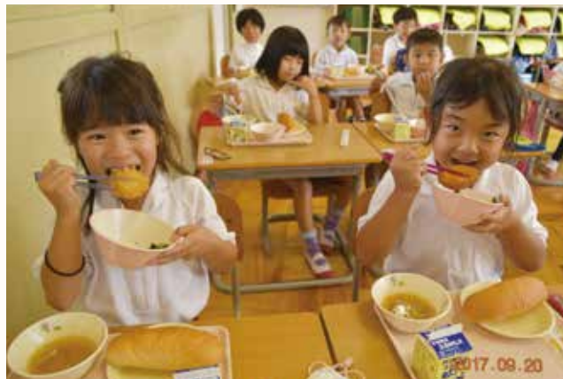
▲1日限定の加西コロッケを食べる北条小学校の児童

栄町で収穫したじゃがいも約150kgと鷯野町で収穫した玉ねぎ約37kgを使用し、学校給食メニューとして、市内小・中・特別支援学校の子どもたちへ「加西コロッケ」を提供しました。