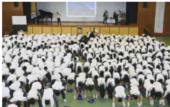
参加者約700人で股のぞきをして記念撮影