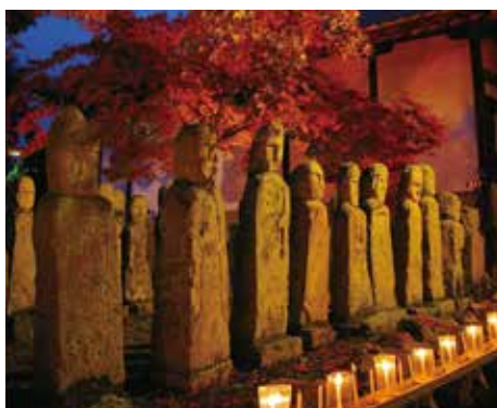
ライトアップされた石仏と紅葉

問合せ／五百羅漢保存委員会事務局（文化・観光・スポーツ課） ☎42-8715 FAX42-8745 kanko@city.kasai.lg.jp