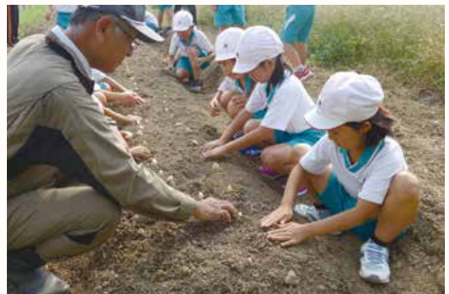
▲約15cm間隔で1つずつ丁寧に植え付けする児童

賀茂小学校2年生16人が、同校農園で加西の特産「ハリマ王にんにく」の植え付け体験をしました。「ハリマ王にんにく」は、85年以上の歴史があり、他の品種にない鮮烈な香りと味が特徴です。 児童は、「ハリマ王にんにく研究会」のメンバーと約200個を植え付けました。今後、草引きなどをして、来年6月頃に収穫し、給食で味わいます。