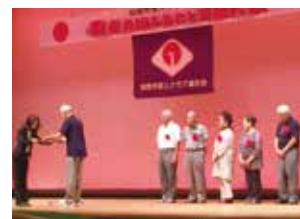
健康福祉会館での表彰式

いくつになっても自分の歯でおいしく食事が食べられるように「しっかり噛む習慣」「定期的な歯科健診」「毎日の歯磨き習慣」を心がけましょう。