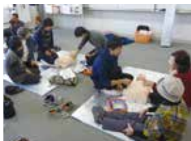
AEDによる心肺蘇生実技

世代や障がいを越えた市民の参加と交流により、健康と福祉への理解を深めていただくため「2017 健康福祉まつり～はじめよう 家族みんなでココロとからだの健康づくり～」を開催します。