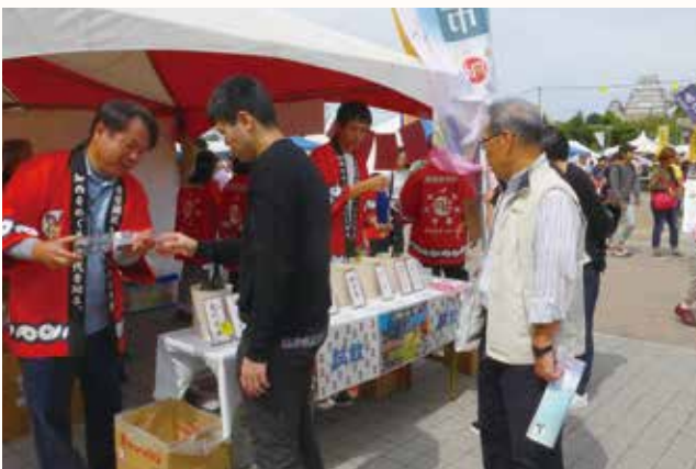
▲加西の酒を試飲する来場者ら(加西ブランド協議会ブース)

姫路大手前公園で9月30・10月1日、豊穰の国・はりま大物産展が開催され、加西市から加西ブランド協議会(加西の酒等)・玉野町営農組合(玉野産小麦の Pasta等)・高橋醤油(醤油ラーメン等)が参加しました。 また、ねっぴ〜も登場して子どもたちから大人気でした。2日間で県内外から訪れた約55,000人が、加西市をはじめとする播磨の魅力を堪能しました。