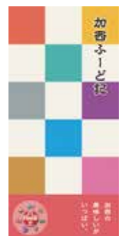
加西ふーど記のガイド本