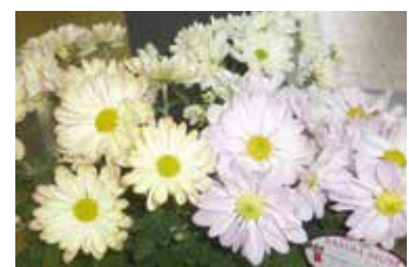
市役所に展示のサンバママ

市内の増田園芸が鉢物の栽培に取り組み、今秋初出荷を迎え、このほど加西市に贈呈されました。12月上旬（予定）まで市役所ロビーに展示しています。