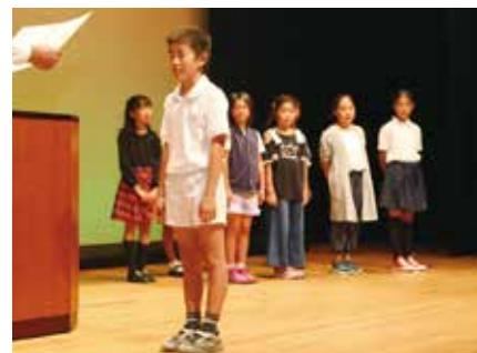
環境講演会で表彰(9月30日、健康福祉会館)

自然の大切さを知り、環境に対する意識を深め、不法投棄・ポイ捨て禁止を呼びかけることを目的としています。