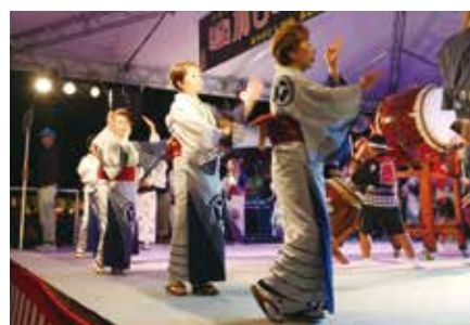
加西音頭総踊り／芸能協会の音頭で市内企業や高校生などが一体に