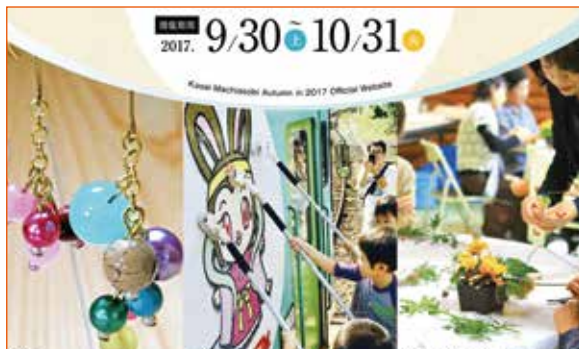
公式 Web サイトのトップページ

■一部のプログラムは公式 Web サイトから申し込みが可能 地域体験プログラムの詳細など、「かさいまちあそび」の魅力が詰まった公式 Web サイトを9月1日(金)に開設します。一部のプログラムでは、Web サイトよりパソコンやスマートフォンから予約申し込みが可能で、残席数も表示しています。また、facebook ページも開設していますので、皆さまの「いいね！」をよろしくお願いします。 かさいまちあそび 2017 で検索。