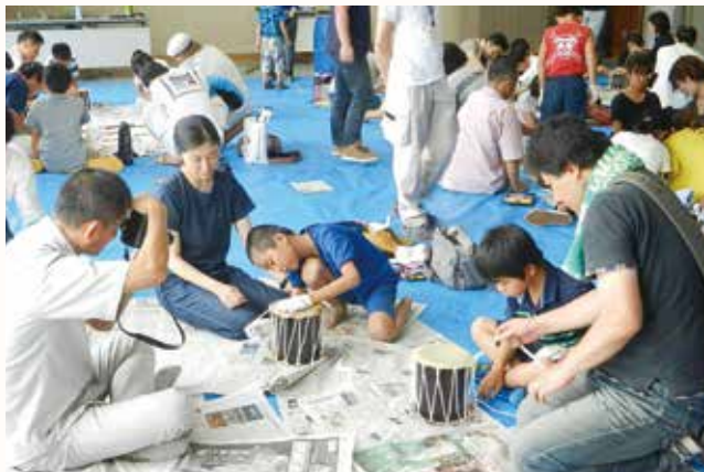
▲親子で協力しながら太鼓を作る参加者

命について考える学習会として、牛の皮を使った「夏休み太鼓作り教室」が善防公民館で行われました。