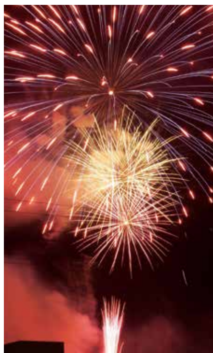
打ち上げ花火／迫力満点の花火が加西の夜空を彩る

■「サイサイまつり」サンテレビ放映 日時／9月10日(日) 14:00～14:55