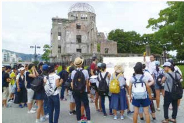
▲原爆ドームを訪れた生徒たち