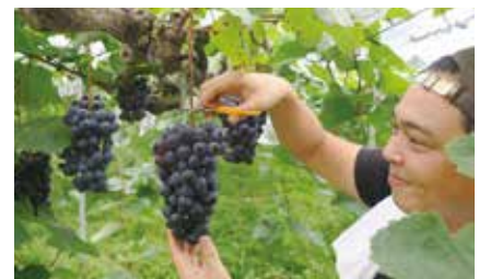
新規就農者が収穫するゴールデンベリーA

また、近年は新規就農者などの参入により多くの若者がぶどう作りに取り組んでいます。