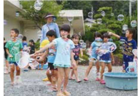
シャボン玉遊びをする子どもたち

転入・転出の人口比率や新設住宅着工戸数など、まちの活力や住環境整備の指標である「快適度」と、病院の病床数や保育所定員数など、安心して生活できる指標である「安心度」が上がったことで、昨年より順位を上げています。