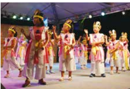
ねっぴ～ダンス／子どもたちが元気いっぱいダンス