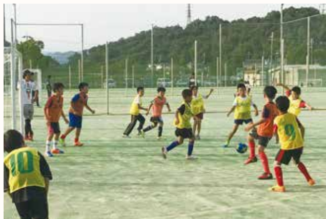
▲ミニゲームを楽しむ子どもたち

「フットサルアカデミー 2017」が、7月5日から毎週水曜日に多目的グラウンドで行われています。