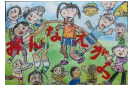
岡さんのポスター

ポスター・標語は、人権意識の高揚を図り、差別解消への意識を高めるために、市内の小中学生などから募集し、応募のあった2,048点から入賞作品が決定しました。入賞作品（最優秀賞・優秀賞・教育委員会賞・佳作）は、9月1日から28日まで、アステアかさい3階地域交流センターで展示します。