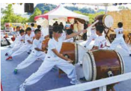
ステージパフォーマンス／宇仁の里ふるさと太鼓による和太鼓演奏