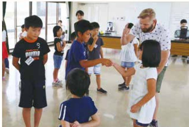
▲先生の指導を受けながら、英語で自己紹介をする子どもたち