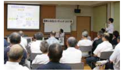
富合地区のタウンミーティング