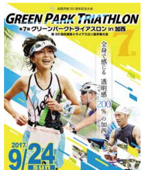
トライアスロン大会のポスター

※観覧者駐車場は、ぜんぼうグリーンパーク(8:30～13:00は入出庫不可)、JA兵庫みらい善防支店、播磨横田駅、岸呂町集出荷施設をご利用ください。 ※最新情報はグリーンパークトライアスロン in 加西のフェイスブック( https://www.facebook.com/gptkasai/ )をご覧ください。