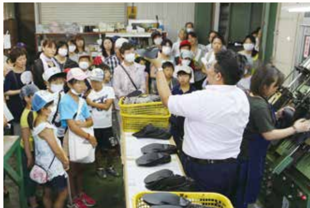
▲(株)マリアンヌ製靴で靴の製作過程を教わる参加者

加西商工会議所は、地元企業への関心を高めてもらうことや社会体験学習の一環として、7月26、28日に「夏休み産業・観光ツアー in かさい」を開催しました。