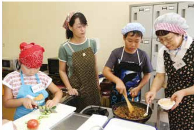
▲タコライスの具材を作る参加者

加西市農村女性組織連絡協議会が主催の「親子料理教室」が市民会館で行われ、親子 10 組 23 人が参加しました。