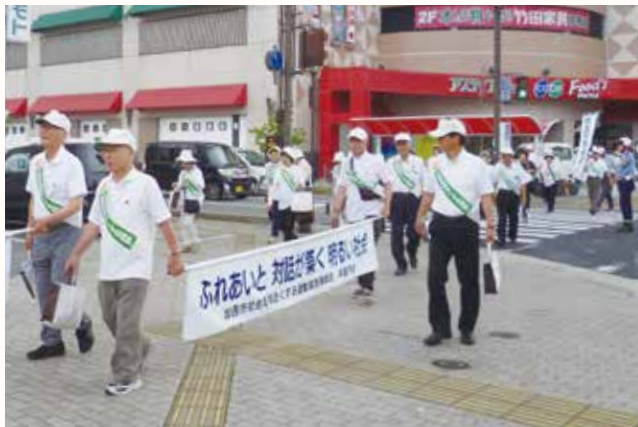
▲キャンペーン用品を配りながら啓発活動をする参加者

犯罪や非行をした人たちの再犯・再非行をなくし、「あやまち」からの立ち直りを支える地域をつくろうと、北播保護司会加西分区や更生保護女性会、警察、市などが、「社会を明るくする運動」を行いました。