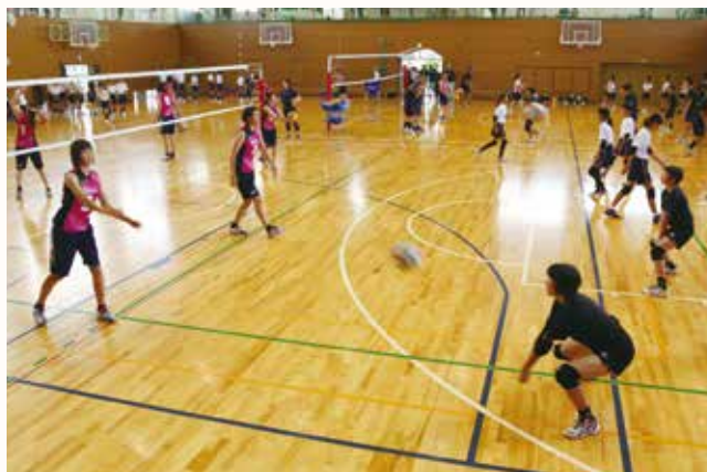
▲レシーブの基本を教わる参加者

加西市制 50 周年記念事業として、プロクラブチーム「ヴィクトリーナ姫路」の選手らによるバレーボール教室と、同チームゼネラルマネジャーの真鍋政義さん（前全日本女子代表監督）による講演会を開催しました。