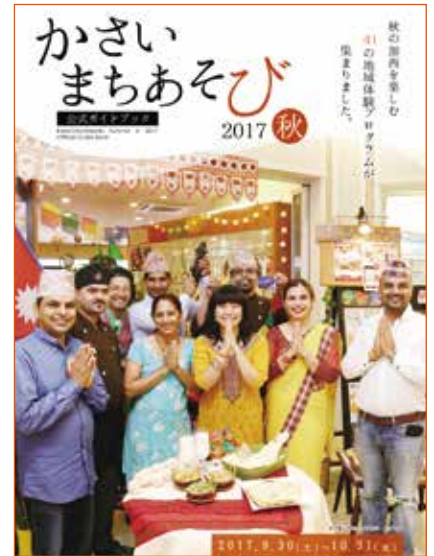
ガイドブックの表紙は「ムナール」