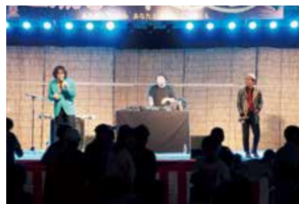
前夜祭／サーカスフォーカスによるライブ演奏