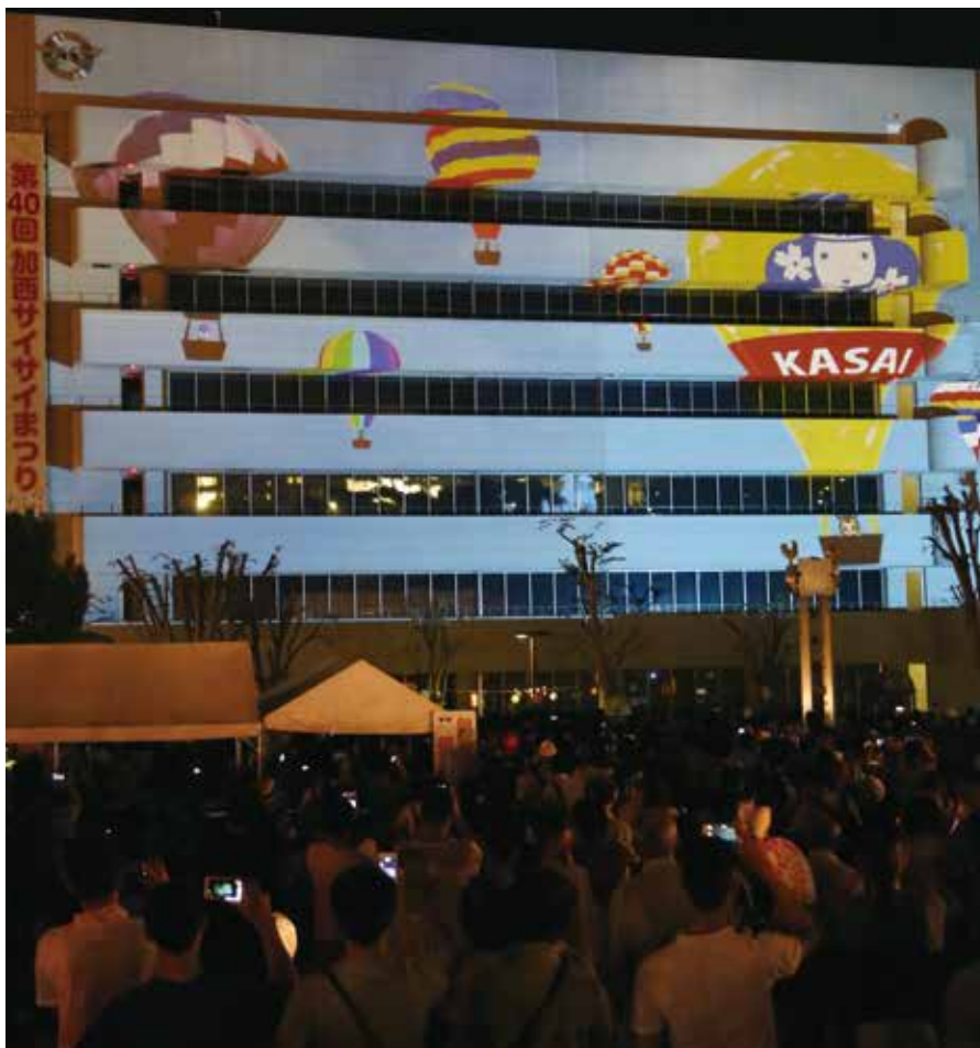
プロジェクションマッピング／第40回記念および市制50周年記念として、京都精華大学と連携し初実施

フィナーレは、花火千発が夏の夜空を彩り、家族連れら約2万5千人でにぎわいました。