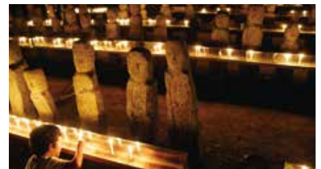
親や子に似た顔の石仏があるとされています