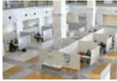
企業ごとに個別面談

加西市には、高度な技術力でグローバルに活躍するモノづくり企業や商業・サービス業等、国内外の産業振興に大きく貢献する企業が多くあります。このような市内企業の人事採用担当者と面談ができる合同就職面接相談会を開催します。事前申込や参加費は不要。