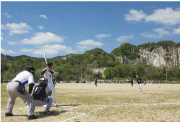
▲地域の交流と熱戦を展開（ぜんぼうグリーンパーク）。

加西市体育協会主催の第40回町親善ソフトボール大会が、アラジスタジアムなどで行われました。出場30チーム500人が熱戦を繰り広げました。