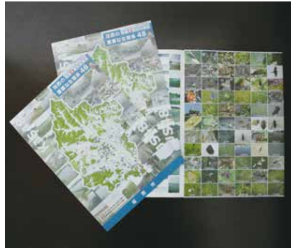
A 4判6ページで2000部作成。フルカラー仕様で市内の生物多様性が視覚的にわかるリーフレット形式。

■リーフレット設置場所／市役所、地域交流センター、図書館、中央公民館、善防公民館、南部公民館、北部公民館