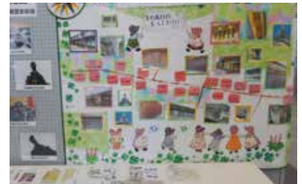
まちづくり活動資料の展示風景