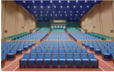
内装を一新した文化ホールの客席

防衛省の防衛施設周辺民生安定施設整備事業補助金を受け実施していた市民会館文化ホールの耐震改修工事が完了し、1月7日にリニューアルオープン記念式典を開催しました。式典ではテープカットを行い、加西市吹奏楽団の皆さんによる演奏が会場を盛り上げました。