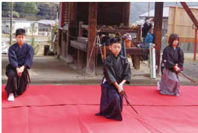
▲居合道を奉納する小学生剣士や女性剣士。

日吉神社で恒例の弓引き神事が行われ、初の試みとして「かさい」居合道教室による居合道が奉納され、新春らしい賑わいとなりました。