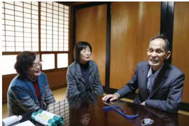
▲70歳以上で支援が必要と思われる同会員宅を訪問。

老人クラブ連合会は、孤独を癒やし、地域のつながりや会員相互の支え合いを深めることを目的に、毎年7月と12月に見守り活動を行っています。