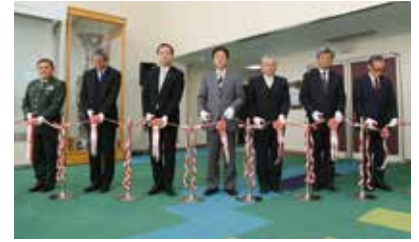
リニューアルオープンを記念してテープカット

座席幅が広がった新客席は798席。車いす用スペースを設け、トイレも洋式化しました。内装は「緑の山々、池や小川、歴史を通じて加西市を形づくってきた自然の色」をコンセプトに安らぎと広がり溢れる空間を演出しています。新装された文化ホールをぜひご活用ください。