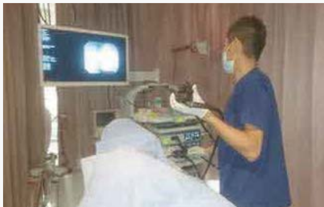
食道がん・胃がん・大腸がんなど、消化管疾患の早期発見、早期治療を目指している加西病院の内視鏡検査