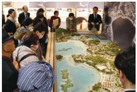
平成28年12月7日にハンセン病人権研修で、国立療養所「長島愛生園」(岡山県瀬戸内市)の歴史館を見学する参加者