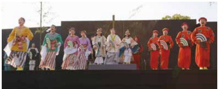
昨年 5 月の「第 1 回加西新能」（玉丘史跡公園）で、新作狂言『根日女』を精一杯演じたこども狂言塾の塾生

■申込先／〒 675-2395 加西市北条町横尾 1000 文化・観光・スポーツ課 ☎ 42-8756 FAX 42-8745 bunka@city.kasai.lg.jp