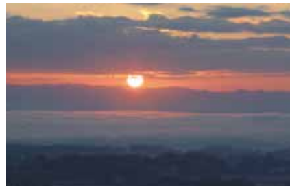
ランドマーク展望台からの2017年初日の出