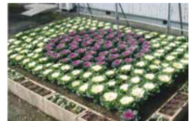
鶉野中町老人クラブの花壇