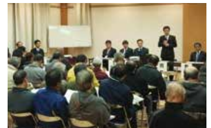
賀茂地区のタウンミーティング