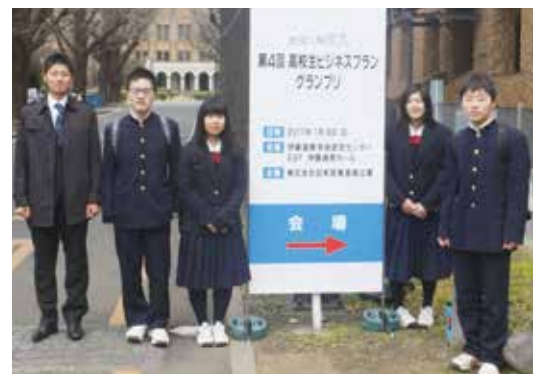
優秀賞に輝いた播磨農業高校の生徒ら

同校は、沖縄県の高校と組み、①耕作放棄地の増加②商店街のシャッター通り化という地域課題を解決するため、食育を促す農業の模擬体験アプリを作り、農産物を家庭で食べるほか、それぞれの地域の商店街でマルシェを開催し、販売するシステムを考案。全国から324校、2,662件の応募があり、兵庫県から初のトップ10に選ばれ、優秀賞に輝きました。