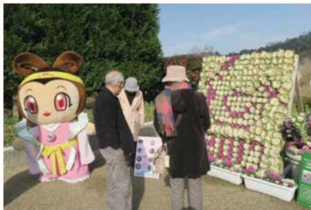
▲ハボタンの干支飾りを見入る来場者。

県立フラワーセンターの新年のお出迎えとして、加西産ハボタンによる干支飾りが登場しました。