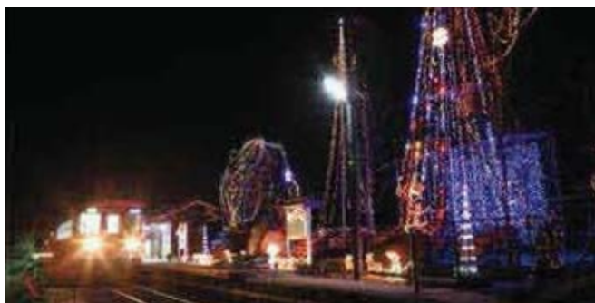
播磨下里駅のイルミネーション