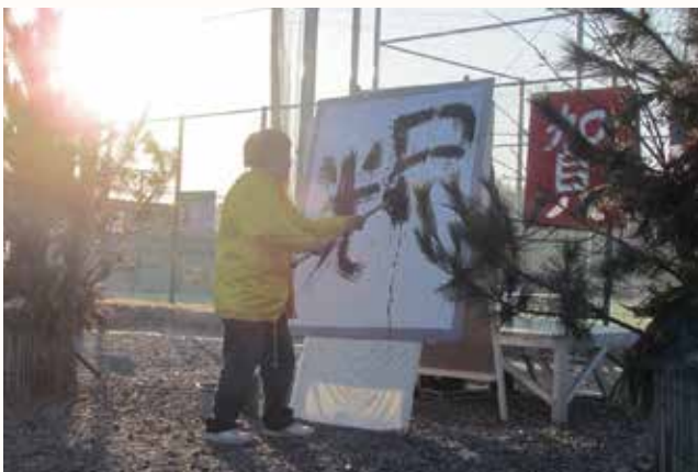
▲「輝」を書き初めた水田会長。

加西市青少年団体連絡協議会が主催する「新春のつどい」が開催され、約590人がいこいの村裏山のランドマーク展望台に登り、初日の出を拝みました。