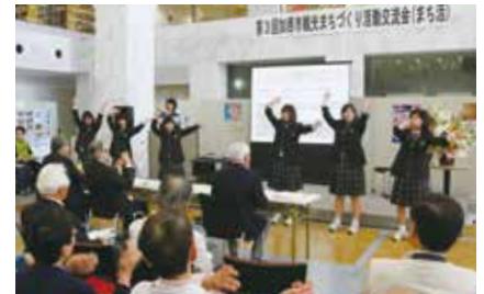
昨年の交流会で、活動報告をする北条高校生