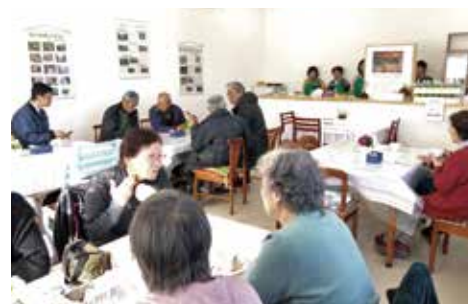
多くの方で賑わうふれあい喫茶

活動の一環として1月13日にふれあい喫茶がオープン。多くの方が集まり、久しぶりの再会を楽しんだり、まちづくりについて話をしたりしていました。今後は月2回(第2・4金曜日9:00～11:30)、コーヒーや紅茶、ジュースを100円で提供されます。