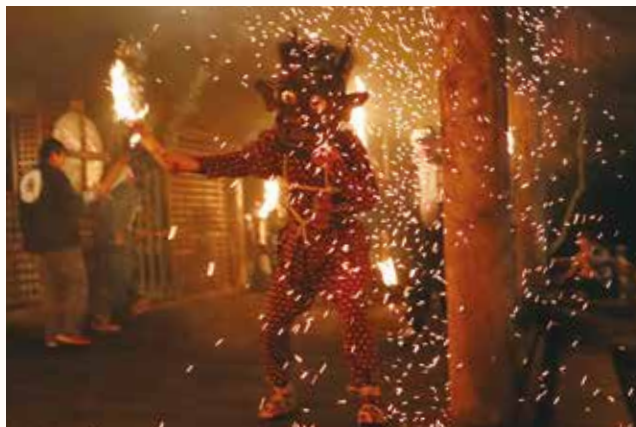
▲柱にたいまつを打ち当て、本堂の周囲を暴れ回る赤鬼。

室町時代から続く国重要無形民俗文化財「田遊び・鬼会」が、上万願寺町の東光寺で行われました。