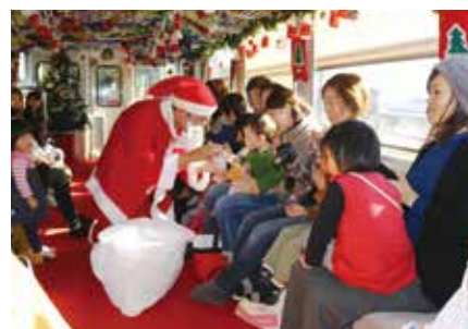
毎年大人気のサンタ列車