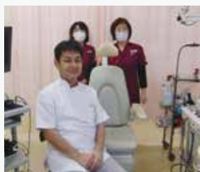
耳鼻咽喉科のスタッフ

蓄膿症という名前の病気を聞いたことがあると思いますが、正式名称は慢性副鼻腔炎です。今回は、慢性副鼻腔炎とその治療について解説します。