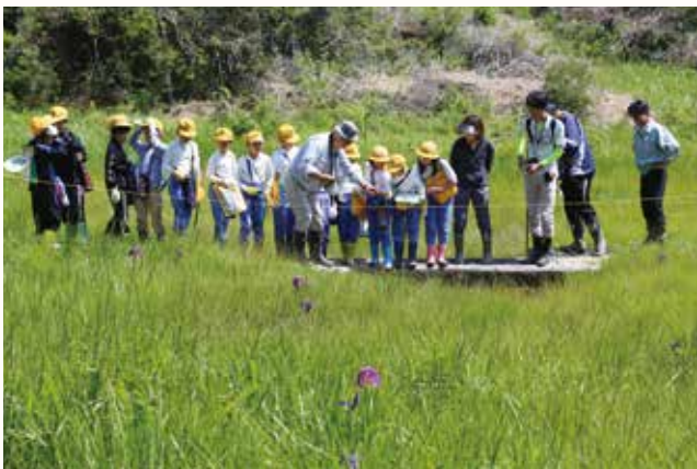
▲6月10日は富合・日吉・宇仁小学校の児童が観察。

市内の小学生が環境体験学習として、6月3日から7月5日まで順次「あびき湿原」を訪れ、ふるさとの自然や生き物について学びました。