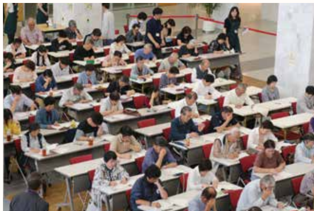
▲独特な表現「播州弁」の問題を解く参加者。

図書館が、長い歴史の中で地域に息づく播州の方言に着目し、郷土愛を育もうと、「ちょっとおもしろい播州弁検定」を行いました。