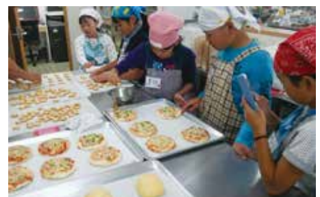
「世界に一つだけ」オリジナルパン作り体験