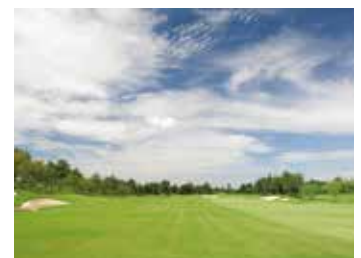
ゴルフ芝の修復が完了したゴルフコース