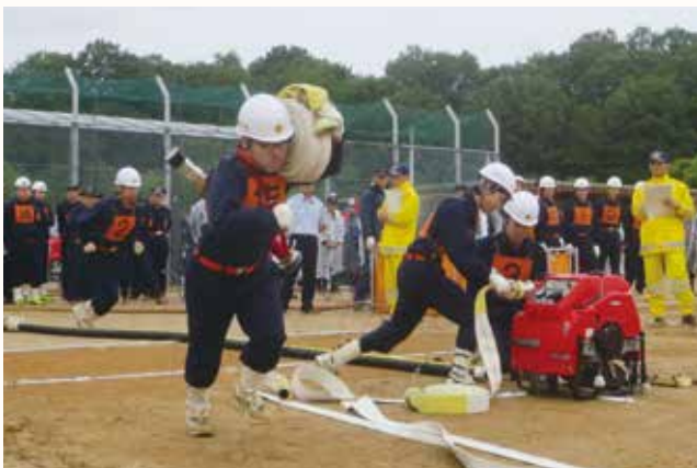
▲小型動力ポンプの部で操法を披露する都染部の団員。

消防活動に必要な団員の連携や災害時に即応できる技術を習得することを目的に「第30回加西市消防操法大会」が、市民グラウンドで行われました。