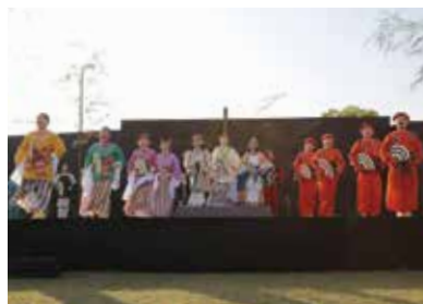
5 月の加西新能（玉丘史跡公園）で狂言を披露した加西市こども狂言塾の塾生