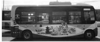
昨年度、加西市では宝くじの社会貢献広報事業でコミュニティバスを購入