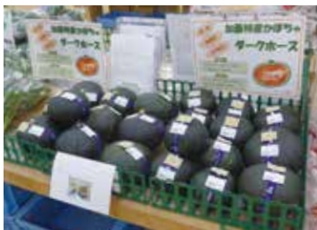
甘くて、天ぷらやスープなどに適したダークホース

「売れるものをつくる」をコンセプトに、新品種のかぼちゃ（ダークホース）の栽培に取り組む方を募集します。プロの栽培指導を受けながら、ともに産地作りに挑みましょう。