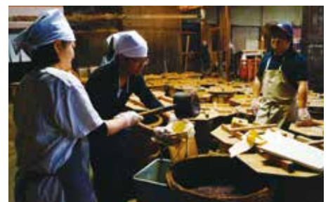
醤油蔵見学&醤油づくり体験

KASAI データバンク 人口／45,136(－16) | 男／21,929(－8) | 女／23,207(－8) | 世帯数／17,372(+24) H28.5.31現在(前月比) 5月の出生数／16人 死亡数／59人 ■7/13、27は市民課・国保医療課窓口を延長(17:15～19:00)