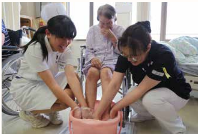
▲看護師の指導を受けながら足浴に取り組む生徒（左）。

加西病院は、看護についての理解や関心を高めてもらうことを目的に「ふれあい看護体験」&「ふれあいコンサート」を行いました。