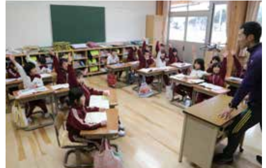
3 月から新校舎で授業を受ける西在田小学校の児童

西在田小学校の新校舎が 2 月に完成したことにより、全学校の耐震化が完了し、子どもたちが安心して学ぶことのできる環境が整いました。また、学力向上プロジェクトとして全学校図書室の蔵書数を増やすとともに、インターネットを用いた「e ラーニング」を開始します。