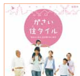
ライフステージに合わせた施策をまとめたパンフレット「がさい住タイル」

5 月には、若者の能力や感性を生かした活動をする加西市独自の「地域おこし協力隊員」を 2 人増やし、計 4 人が地域住民と連携し地域活性化に取り組んでいます。また、加西市の伝統文化をはじめ、加西市こども狂言塾による狂言を継承していきます。