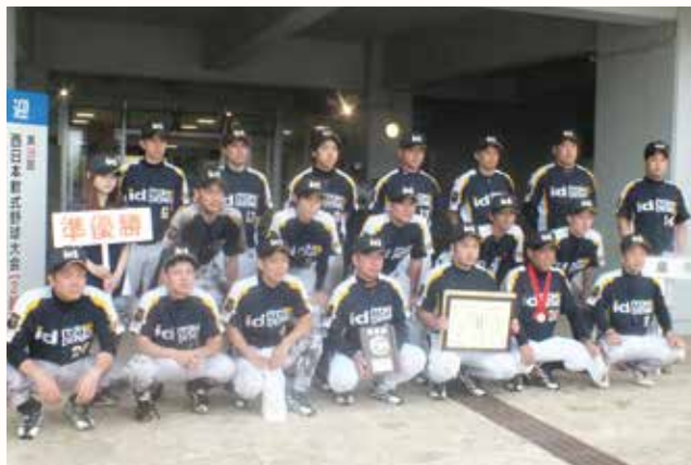
▲チーム一丸で準優勝したメンバー。

加西市は、6月10日から13日に沖縄県で行われた「第38回西日本大会（2部）」に出場した伊東電機株式会社の軟式野球部に賞賜金を贈呈しました。