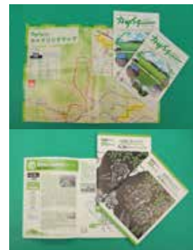
市役所や観光案内所（北条町駅）などで無料配布しているサイクリングマップ（上）とハイキングマップ

また、まち歩きや手作りアート、熱気球搭乗体験などのさまざまな体験を通じて、加西市の魅力を再発見する「まちあそび 2015・秋」が大好評でしたので、今年も 10 月に開催します。多くの方の参加をお待ちしています。