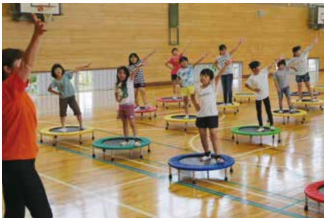
▲ポーズを決める児童ら。

富合小学校の児童26人が、ミニトランポリンを使って歩いたり、弾んだりする「トランポ・ロビックス」に挑戦しました。