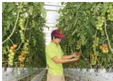
昨年 10 月からミニトマトの出荷が始まった「次世代施設園芸モデル団地」