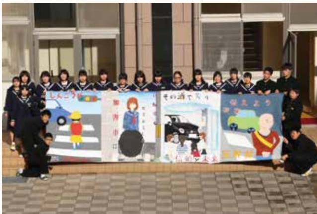
▲約2週間かけて制作した北条中学校の美術部員。

北条中学校の美術部員が、加西警察署の助言を得ながら長さ5m、高さ1.5mの交通事故防止ポスターを制作し、同署に贈りました。交通事故の報道が増えていることもあり、ポスターには子どもから高齢者までの各世代に呼びかける絵が描かれています。