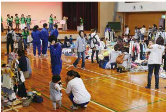
▲フリーマーケットやバンド演奏を楽しむ参加者。