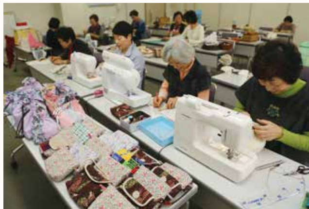
▲ポシェット「元気袋」を作るメンバー。

加西市老人クラブ連合会の友愛女性部は、熊本地震の被災者に少しでも元気を届けたいとの思いで、ポシェット「元気袋」を作りました。