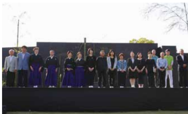
「加西市こども狂言塾」の塾生を支えてきた応援隊の皆さん