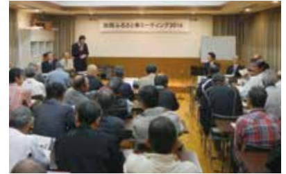
富田地区のタウンミーティング