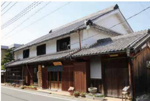
▲カフェや旅館として、地域の活性化にも貢献する水田家住宅。

昔ながらの旧家のまちなみが残る北条町横尾の旧丹波街道沿いにある水田家住宅が、兵庫県景観形成重要建造物に指定されました。市内では、平成21年の高井家住宅（北条町横尾）について2件目です。