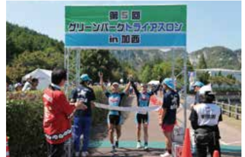
笑顔でゴールする選手（第5回大会）