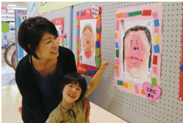
▲今回で4回目となった北条幼稚園児の作品展。

母の日(5月8日)に合わせ、北条幼稚園の5歳児21人が母親の顔を描いた作品展(NPO法人「まちづくり北条」主催)が、アステシアかさいで行われました。