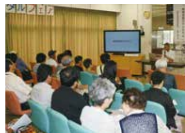
昨年の講演の様子

体験コーナー：胎児4Dエコー体験（他院で受診されている妊娠6～8カ月程度の10名）、心肺蘇生法、医療者制服着用体験、腹腔鏡手術模擬体験、感染防止手洗い法、電気メス体験、お菓子で「薬」づくりなど