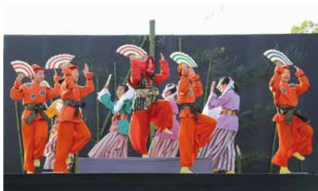
熱演する「加西市こども狂言塾」の塾生（新作狂言『根日女』）