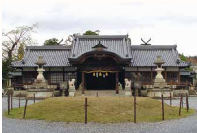
▲市指定文化財となった住吉神社(北条町北条)。

加西市教育委員会は、文化財保護のため住吉神社境内建造物を市指定文化財に指定しました。