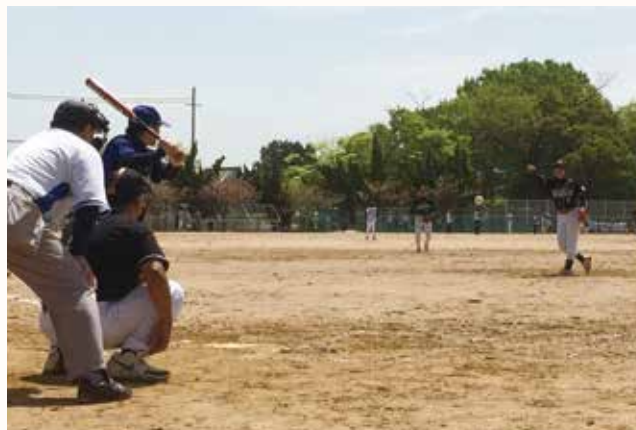
▲地域の交流と熱戦を展開（北条中学校グラウンド）。

加西市体育協会主催の第39回町親善ソフトボール大会が、アラジンスタジアムなどで行われました。出場29チーム522人が熱戦を繰り広げました。