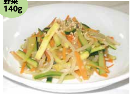
ニンニクの香りが食欲アップに