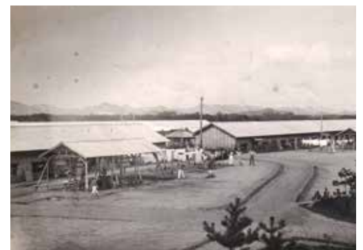
当時の収容棟（青野原町公民館付近から撮影されたものと推定）