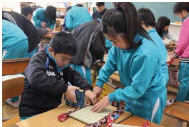
▲タッカーを使いこなす児童。

賀茂小学校の 4 年生 27 人が、社会科の学習の一環としてミニ畳づくりに挑戦しました。