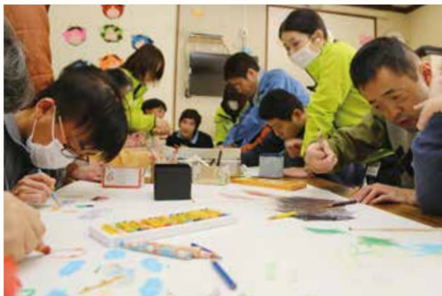
▲ロゴマークのイメージを考える利用者とデザイナー。

障害福祉サービス事業所の市立善防園の利用者とデザイナー（姫路市）が、善防園のロゴマークづくりや新商品の開発に取り組んでいます。デザイナーは、シティセールス事業の一環として協力いただいています。