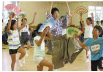
昨年のお稽古の様子

毎年5月に舞台上で野村萬齋さん監修・演出の狂言『根日女（ねひめ）』を演じることも狂言塾の第3期生を、3月18日（金）まで募集しています。3月15日（火）には、野村萬齋さんによるお稽古を公開します。参加を検討している小学生が対象で事前予約が必要です。