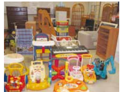
販売予定のタンスやコンビカーなど

■ 販売方法 ／家具・自転車など物品により指定した日に抽選販売します。お一人さまの購入数についても制限があります。詳しくは展示場で確認してください。