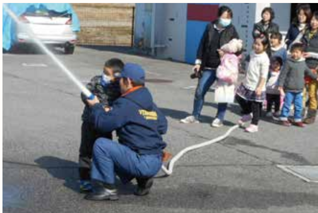
▲消防署員と放水体験をする子どもたち。

防災意識を高めようと、加西市女性団体連絡会主催の「消防署一日体験」が、北はりま消防組合加西消防署で行われました。