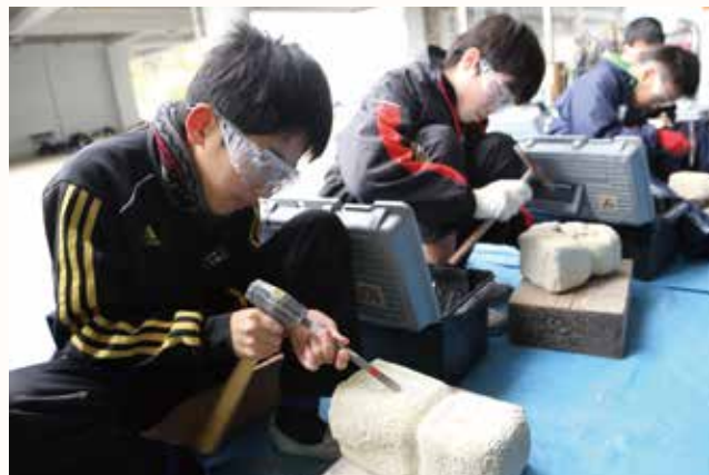
▲完成作品は 3 月 8 ～ 14 日にアスティアかさいで展示。

北条東小学校の 6 年生 10 人が、クラブ活動（年間 10 回）で石仏彫りに挑戦しています。