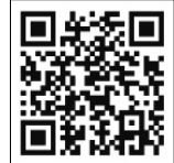
加西市ホームページ