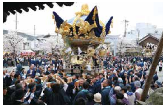
境内を練り歩く化粧屋台

KASAI データバンク 人口／45,301（－28） | 男／22,021（－4） | 女／23,280（－24） | 世帯数／17,298（＋21） H28.1.31 現在（前月比） 1月の出生数／24人 死亡数／52人 ■ 3月の毎週水曜日は市民課・国保医療課窓口を延長（17:15～19:00）