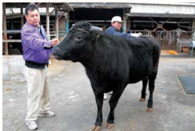
▲牛が快適に過ごせるよう掃除・換気などに力を入れ育てられる。

地域の特色ある農産品や食品の名称を国が保護する地理的表示（GI）保護制度の第一弾に、「神戸ビーフ」と「但馬牛（たじまぎゅう）」が登録されました。