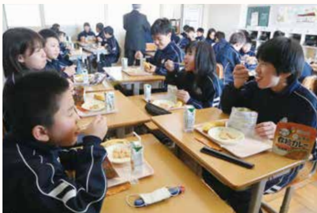
▲防災について考えながら、カレーを食べる泉小学校の6年生。

教育委員会は阪神・淡路大震災の教訓を伝えようと、小・中・特別支援学校で防災給食を初めて実施しました。