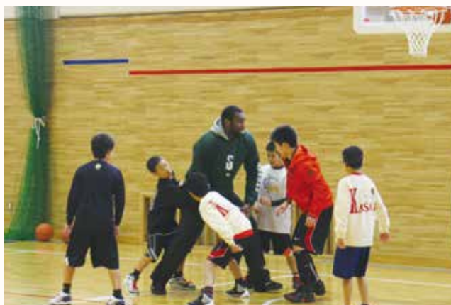
▲プロバスケットボール選手と試合をする小学生。

プロバスケットボールチーム「西宮ストークス」の選手による「バスケットボール秘密特訓の日」が、善防中学校で行われ、小学生ら約110人が参加しました。