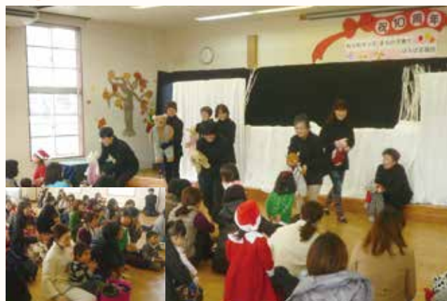
▲ 10 周年記念として人形劇を楽しむ参加者。

ねひめキッズ（つどいの広場）とまちの子育てひろば応援団が、活動 10 年目を迎えました。