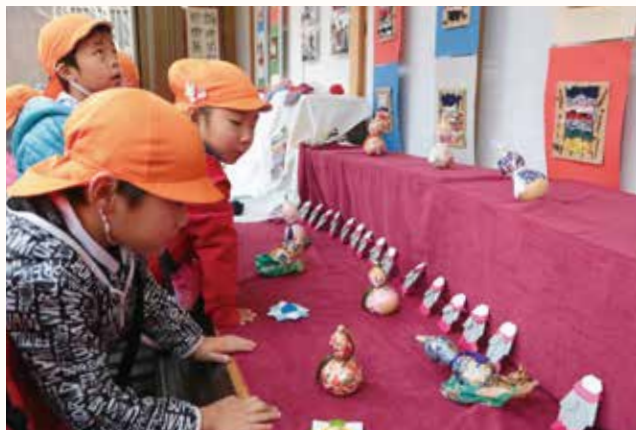
▲自分たちの作った作品を見つめる園児。

泉幼稚園の5歳児20人が作った壁飾りや置物の作品展が、五百羅漢ミニギャラリーで行われました。