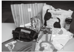
ウエストポーチなどの記念品

健康のためには運動が大事だとわかっているけれど、なかなか取り組むことができないと思っている方、この機会に運動を始めてみませんか。申込方法など、詳しくはお問い合わせください。