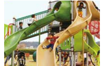
玉丘史跡公園の大型複合遊具で遊ぶ子どもたち