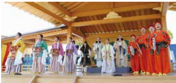
こども狂言塾による新作狂言『根日女』

11:00～12:00 新作狂言『根日女(ねひめ)』／出演: 笛方・藤田六郎兵衛(藤田流十一世宗家)、こども狂言塾 13:00～16:30 シンポジウム「風土記の神話を考える」 ／現存する5つの風土記の研究者による講演など