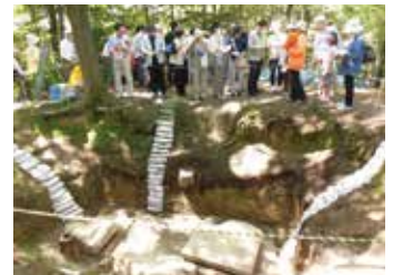
玉丘古墳の長持形石棺

9:00～12:00 「播磨国風土記ゆかりの地をめぐる」バスガイドツアー 先着40人(事前予約制)・参加費無料 10:00～12:30 玉丘古墳ガイドツアー／申込不要・参加費無料 10:00～17:00 地域特産品&グルメ 販売「5ヶ国ふんど記」 現存する風土記5ヶ 国の地域特産品を集 めた物産展や市内グ ルメブース