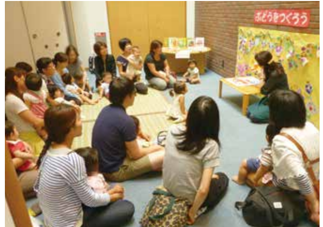
幼児から小学校低学年を対象とした「絵本の読み聞かせ」

図書館では、子どもたちと本をつなぐために、「読書手帳」や「巡回図書」などで、児童・生徒の読書推進を図っています。他にも、幼児から小学校低学年を対象とした「絵本の読み聞かせ」、親子で楽しめる「おはなし会」などの取り組みを行っています。詳しくは、図書館ホームページをご覧ください。