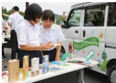
読みたい本を探す生徒