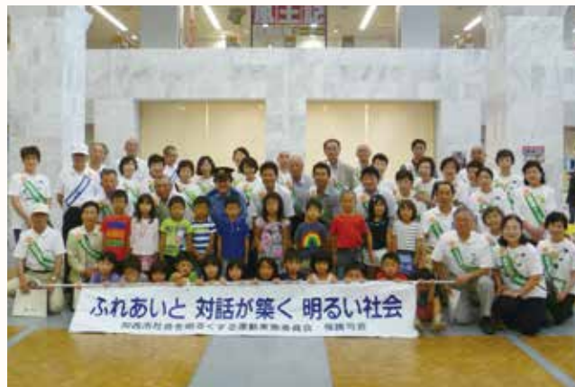
▲社会を明るくする運動に参加したメンバー。

犯罪や非行をした人たちの再犯・再非行をなくし、「あやまち」からの立ち直りを支える地域をつくろうと、北播保護司会加西分区や更生保護女性会、警察、市などが、「社会を明るくする運動」を行いました。