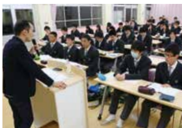
4 月に開講したアフタースクールゼミ

加西市の補助金や加西商工会議所会員事業所の寄附金、北条高校 P T A や同窓会の助成金を財源として、3 つの事業に取り組むこととなりました。