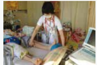
ベッドで行えるゴムボール運動

急性期では安静を保つことは、循環や呼吸状態を安定させるために必要です。しかし、安静期間が2~3日以上になると、筋肉が痩せ、ストレスが増え、体力が低下するなどデメリットが多くなります。そのため理学療法士など他職種と検討しながら、早期リハビリや早期離床に努めています。