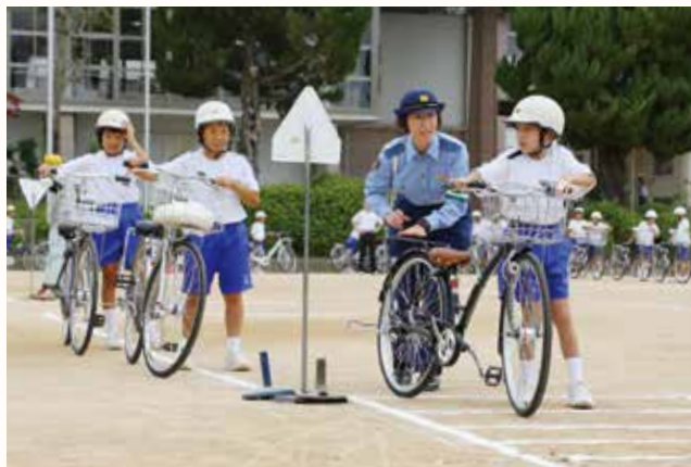
▲安全確認をして、交差点を渡る練習をする生徒。

これまで北条中学校は徒歩通学でしたが、2学期から自転車通学が始まります。そこで、交通ルールや運転マナーを学ぶ「交通安全教室」が行われました。