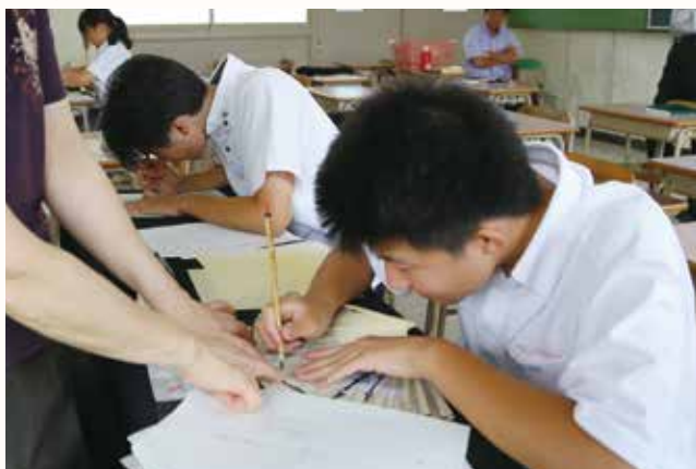
▲扇子に毛筆で書いて、プレゼントを作る生徒。

夏休みに、オーストラリアやタイに海外研修に行く北条高校生14人が、ホームステイ先の家族に渡すプレゼントを作りました。