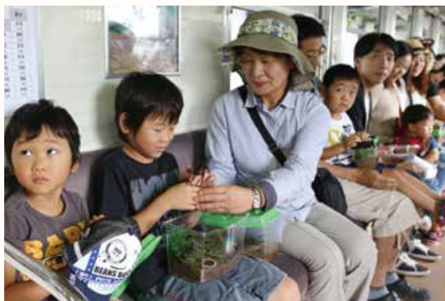
▲かぶと虫を手取る参加者。

北条鉄道は、車内を木の小枝や葉で飾り森に見たてた「かぶと虫列車」を2日間(11便)運行しました。