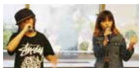
ダンスボーカルユニット「BRAVE」

小・中学生とBRAVEの共演によるプロモーションビデオを制作し、加西市から全国へ元気を発信していきます。詳しくは、8月10日以降に市ホームページをご覧ください。