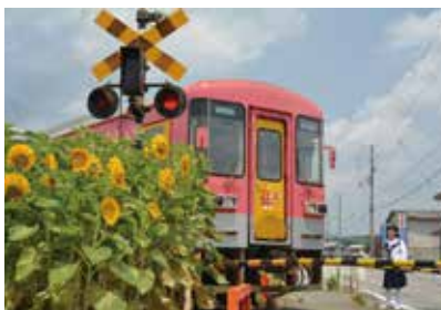
昨年のフォトコンテスト最優秀作品

加西市は、北条鉄道の良さを認識してもらおうと「北条鉄道利用促進キャンペーン」を実施します。