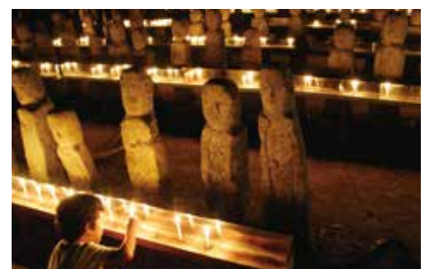
親や子に似た顔の石仏があるとされています。