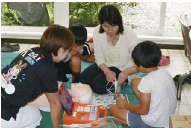
▲心肺蘇生の体験をする参加者。

加西病院は、市民と病院職員が交流することで、病院の活動や現状を知ってもらおうと、「第12回ホスピタルフェア」を開催しました。