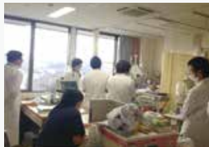
毎朝合同会議を行う

多職種(医師・看護師・理学療法士・薬剤師・臨床工学技士・栄養士など)で毎朝、合同会議を行い、患者さんの情報を共有し、適切に必要な治療・ケアについて検討しています。多職種がチームとなり、より良い医療や看護の提供につながっています。