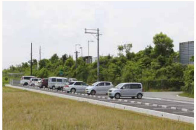
▲オープンした高速バス泉バス停北側の駐車場。

高速バス泉バス停北側に、バス乗車時に誰でも利用できる無料駐車場がオープンしました。自動車25台、二輪車10台が駐車できます。加西から京阪神へのお出かけは、高速バスが乗り換えなしで便利です。ぜひご利用ください。時刻表やルート案内図などは、2月に各家庭に配布の「らくらくおでかけルートナビ」をご覧ください。