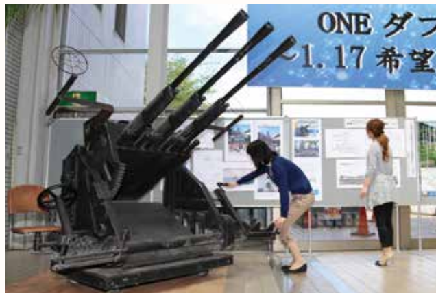
▲模型は鉄と樹脂で造られ、銃身は約1.5m。

映画「男たちの大和／YAMATO」の撮影に使われた対空機銃の実物大模型を、市役所1階に展示しました。機銃は、市と「鶉野平和祈念の碑苑保存会」が子どもたちに平和の大切さを伝えていくため、東映株式会社に譲渡を申し出て、加西市に無償で貸与していただけたことになりました。6月末まで展示し、その後は鶉野飛行場跡地周辺に設置予定です。