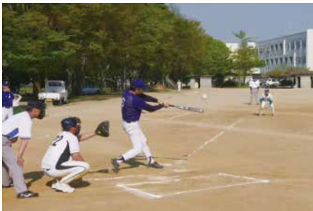
▲地域の交流を深め熱戦が繰り広げられる（善防中グラウンド）。

加西市体育協会主催の第38回町親善ソフトボール大会が、アラジスタジアムなどで行われました。1部15チーム、2部15チームが参加しました。