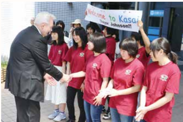
▲3,4月にプルマン市を訪ねた中高生がお出迎え。

平成元年に姉妹都市提携をした米国ワシントン州プルマン市のグレン・ジョンソン市長が、加西市を初めて訪れました。