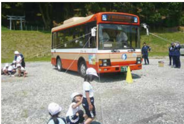
▲運転席から見えないところ（死角）を確認する児童。

加西市・加西警察署・加西交通安全協会・神姫バスは、交通安全意識の高揚や交通事故防止を図ろうと、宇仁小学校で交通安全教室を行いました。