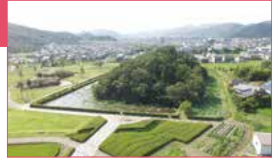
会場の玉丘史跡公園にある玉丘古墳