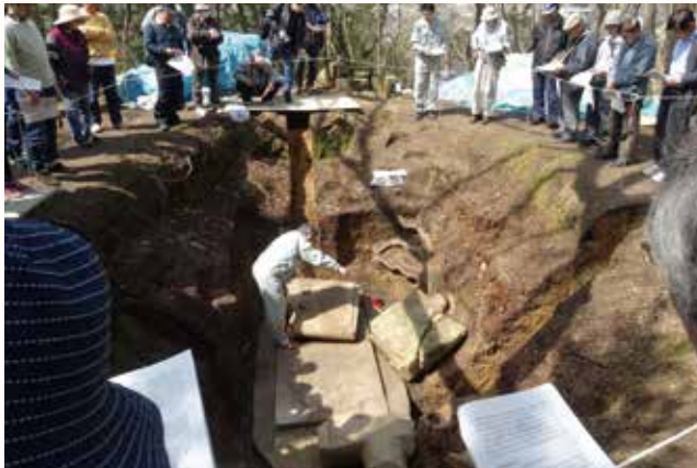
▲長さ約3m、幅約1.6mの底石、ふた石と長短の側石の一部が現存。

玉丘史跡公園内にある玉丘古墳の石棺を84年ぶりに調査し、全国で5番目の大きさと整った美しさを持った長持形石棺であることを再確認しました。