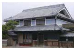
中富町にある空き家

行政の機能（居住希望者と地域住民との調整）と市内不動産事業者の強み（調査・仲介・情報発信等）を生かした新たな空き家バンク制度を整備。