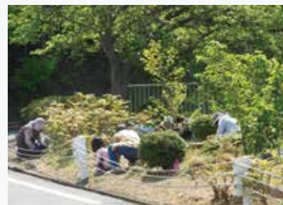
病院の美化作業をボランティアで行っていただいています。

地元で急性期総合病院を持つことは、これまで当たり前の行政サービスと受け取られてきたと思います。それがなければ安心して暮らすことができないからです。