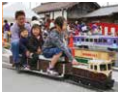
ミニ SL 乗車体験