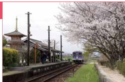
桜が満開の法華口駅