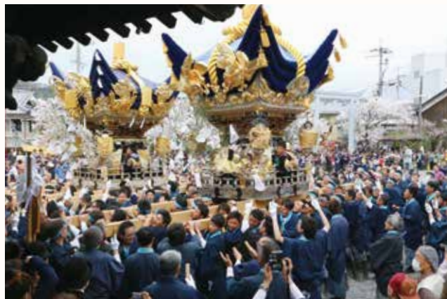
▲「ヨイヤサー、ヨイヤサー」の掛け声で境内を練り歩く屋台。

播州路に春を告げる「北条節句まつり」が、北条町北条の住吉神社などで行われました。