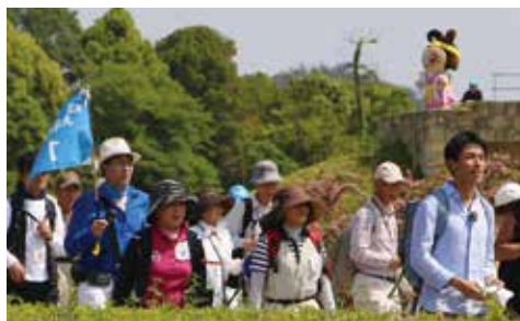
玉丘史跡公園内をウォーキング