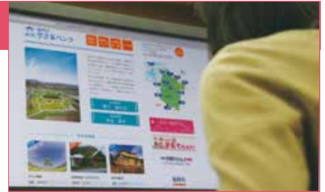
リニューアルした空き家バンクサイト

【問合せ先】 ふるさと創造課(ふるさと創造係) ☎④8706 FAX④1800 furuso@city.kasai.lg.jp