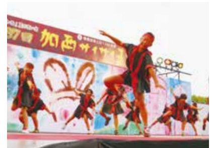
昨年のメインステージでの力強い踊り