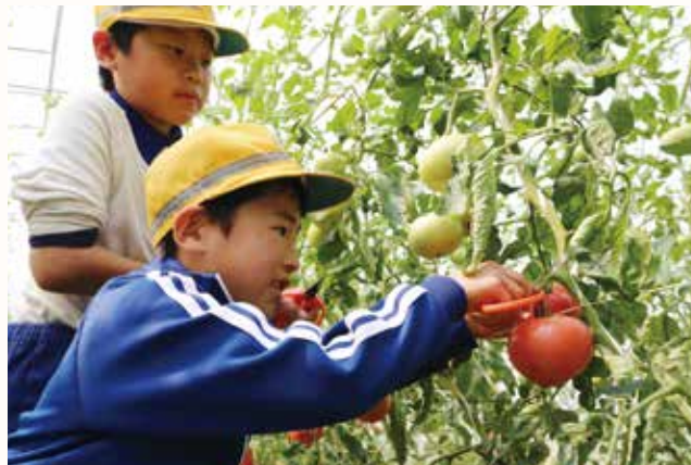
▲丁寧にトマトを収穫する九会小学校の児童。