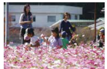
昨年10月のコスモスまつり

また、さくらまつりやコスモスまつりなどのイベントを企画・運営し、地域住民との交流を大切に活動されています。