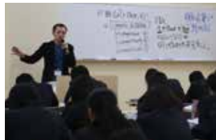
第 1 回の英語の講義（4 月 14 日）

市内唯一の普通科高校を地域が一丸となって支援し、市全体の活性化を図るため、「北条高校活性化協議会」を設立し、4 月から学校法人河合塾による「北条高校アフタースクールゼミ」を実施（11 頁参照）。