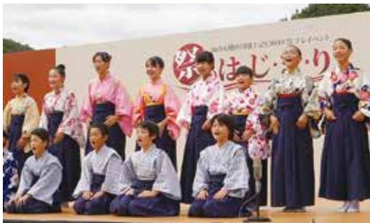
1年間稽古に励んだ「加西市こども狂言塾」の塾生

観覧には座席券が必要です。座席券の販売は終了していますが、芝生広場内に無料観覧エリアと大型モニターを設置します。ぜひご来場ください。