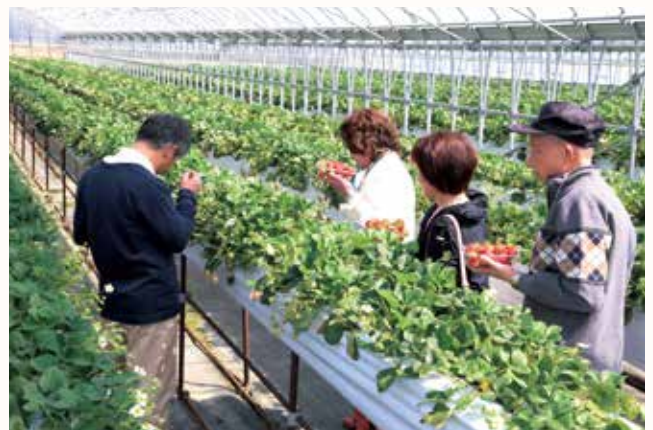
▲会話を弾ませ、いちごを摘む参加者。

60歳以上の方の出会いや人生を豊かにする友を見つける「伴活（ともかつ）」が行われました。