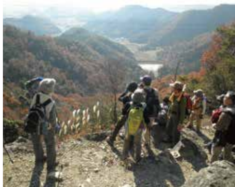
鎌倉山（河内町）からの風景

今こそ、市民一人ひとりがいつまでも健康であり続けるために歩こう。安全なまちを歩こう。仲間たちと歩こう。加西の自然の中を歩こう。