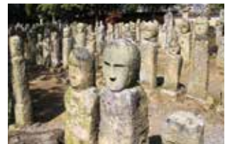
市指定文化財の五百羅漢石仏

地域の歴史や文化に触れる機会を提供することで、市外からの移住を促進するため、移住を希望する方が、市内で一定期間滞在する費用の一部を補助（6 頁参照）。