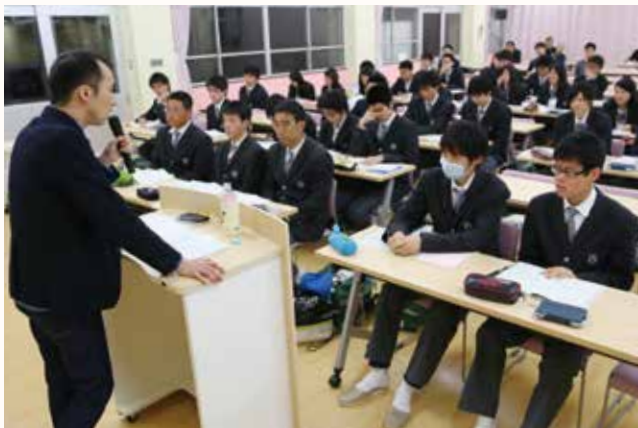
▲英語の講義を受ける3年生58人。

北条高校の活性化を目的として北条高校活性化協議会（市、商工会議所、北条高校PTA、北条高校同窓会、連合PTA）が実施する「北条高校アフタースクールゼミ」が開講しました。学校法人河合塾の講師が、同校の希望者に、英語と数学の講義を対面型で行います。