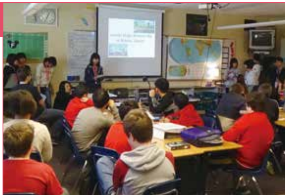
リンカーン中学校で加西市の説明をする中学生親善訪問団

プルマン市とは、平成元年に姉妹都市提携を締結して以来、加西市から中高生を交えた訪問団を15回派遣。プルマン市からも12回の訪問がありました。