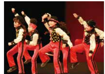
昨年のサブステージでのダンスコンテスト