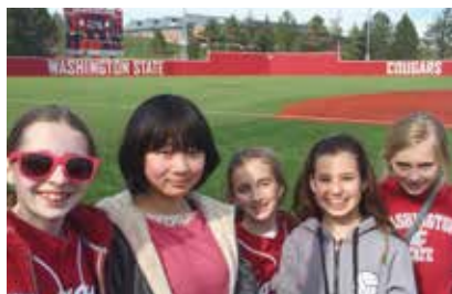
ホストファミリーと一緒にワシントン州立大学で野球観戦