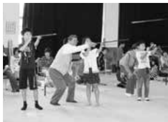
平成25年5月に富合小学校で行われた「吹き矢体験」(イメージ)