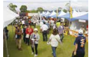
プレイベントの様子（平成26年10月4日、玉丘史跡公園）

■申込先／〒673-1431 加東市社 1386-8（株）神戸新聞事業社 北播支社（事業委託業者）☎0795-42-3326（平日9:00～17:00）FAX0795-42-3319 k0328ym_fudoki1300@kobe-j.co.jp