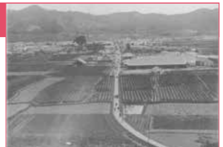
100年前に収容された俘虜が撮影した北条駅前通り(シュミット氏所蔵)

平成27年秋の青野原俘虜収容所開設100年に先立ち、第一次世界大戦とはどんな戦争だったのかを紹介する講演会と資料を展示します。講演会では、青野原俘虜収容所が中央ヨーロッパの写し鏡だったこと。資料展示では、第一次世界大戦の開戦を告げるオーストリアからセルビアへ送った「宣戦布告書」の画像を展示します。