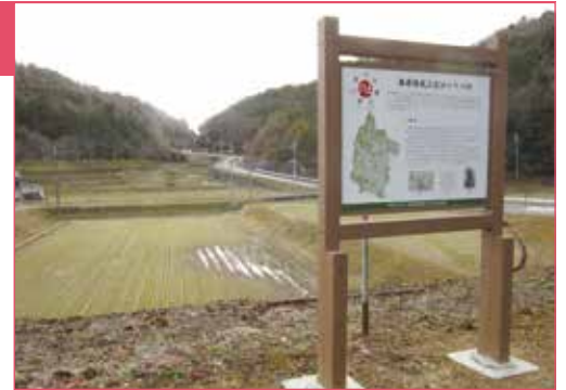
ゆかりの地「鴨坂」の説明看板（縦2.3m、横1.2m）

■設置した場所／①「鴨坂」オークタウン加西前（鴨谷町）、②「ホームチベの井戸」サーフ加西店前（北条町黒駒）、③「三重の里」北条鉄道播磨横田駅北側（西横田町）