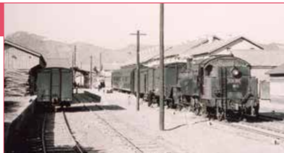
客車と貨車をけん引する蒸気機関車(昭和32年頃、北条町駅)