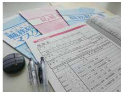
履歴書・職務経歴書の作成イメージ

当所では雇用保険業務や年金相談などは行っていませんが、雇用保険の受給、教育訓練給付、年金との併給調整、再就職手当、傷病手当等の手続き方法、社会保険制度全般に関する問い合わせや相談も多いため、概要の説明を行っています。