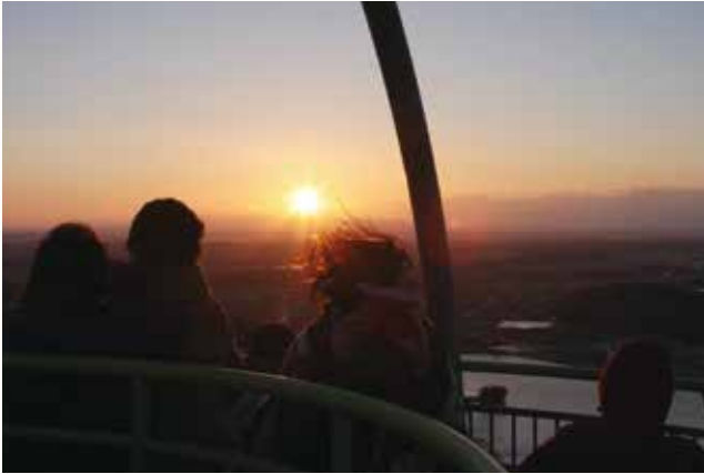
▲午前7時過ぎに雲間から昇る初日の出。

加西市青少年団体連絡協議会が主催する「新春のつどい」が開催され、約400人がいこいの村裏山のランドマーク展望台に登り、初日の出を拝みました。