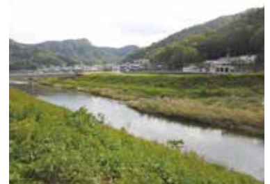
手前が法太川、山の向こうが雲潤里

讃容（さよ）郡条にも、鹿の血で苗代を作ったとの記述があり、昔は鹿や猪の血は、田に霊力を与える呪術的な意味があると考えていたんじゃないかな。