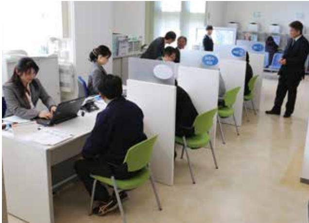
加西市ふるさとハローワークの職業相談コーナー

加西市は、「5万人都市の再生」に向けて、計画的に安定した財政運営を持続させながら、人口増施策に積極的に取り組んでいます。