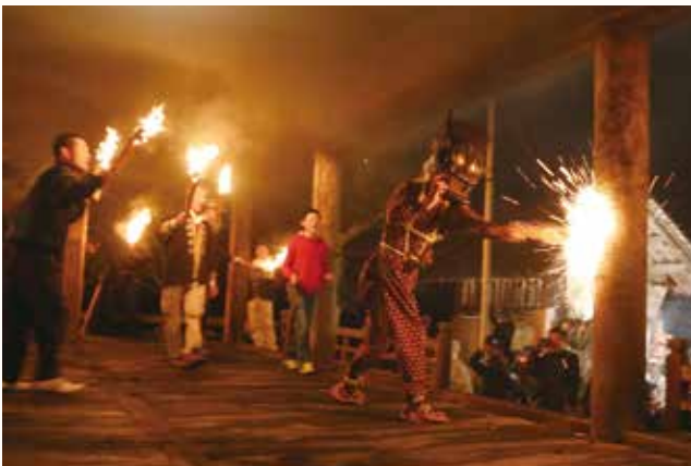
▲柱にたいまつを打ち当て、本堂の周囲を暴れ回る赤鬼。

五穀豊穡や無病息災を祈る国重要無形民俗文化財「田遊び・鬼会」が、上万願寺町の東光寺で行われました。