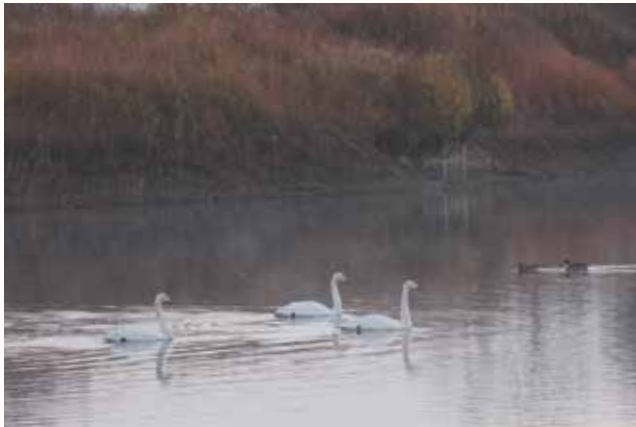
▲水正池（上宮木町）で羽を休めるハクチョウ。

ハクチョウが、約4,000kmに渡る長旅を終え、加西市に飛来しました。加西市の豊かなため池は、ハクチョウの越冬地のひとつです。