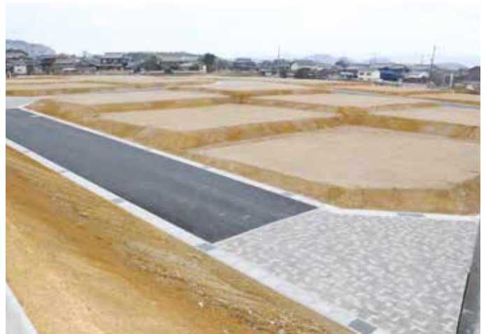
インターロッキング舗装などの道路整備がされた販売区画

交通：北条鉄道「播磨下里駅」(1km) 山陽自動車道加古川北IC（車で7分） 教育：善防認定こども園（徒歩1分） 下里小学校（0.5km） 善防中学校（1.2km） 医療：加西病院（車で10分） ショッピング：マックスバリュ加西南店（1km）