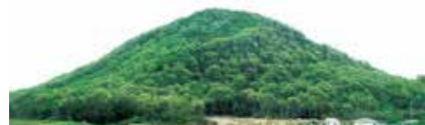
播磨国風土記ゆかりの地「糠岡」(網引町)

播磨国風土記に記され、玉丘古墳群や糠塚古墳群など多くの古墳がある「檜原里(ならはらのさと)」、昭和18年に完成した旧海軍の飛行場跡「鶉野飛行場跡」などを巡る「第12回 加西ロマンの里ウォーキング」を開催します。参加者には記念品、温かいスープのサービスもあり、加西の豊かな自然と歴史を満喫しながらウォーキングをしましょう。