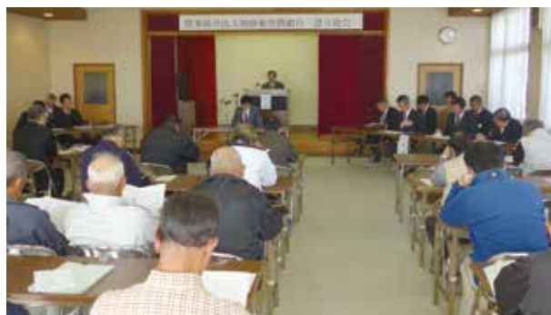
「農事組合法人 別府東営農組合」設立総会

市内では、玉野町、網引町、豊倉町、窪田町、西笠原町の5地区で既に法人化され、計8法人となり、県内で最多となります。