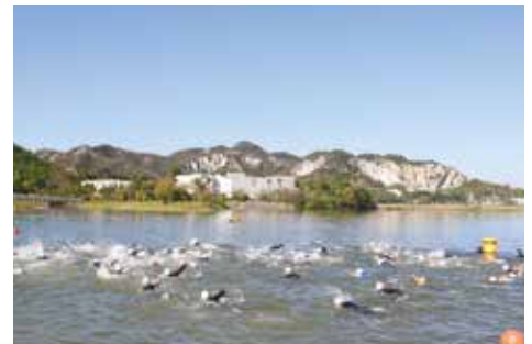
善防山をバックに、ため池を泳ぐ選手

【問合せ先】 グリーンパークトライアスロン in加西実行委員会事務局（商工観光課内） ☎④8740