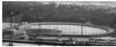
アラジスタジアム

【問合せ】 文化スポーツ課(社会体育係) ☎④8773 FAX④1803 koryu@city.kasai.lg.jp