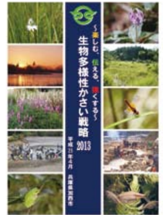
市ホームページで公表中の生物多様性かさい戦略2013

ふるさと加西の生活文化が長い時間をかけて育んできた貴重な自然や生きものを、みんなで守っていきましょう。