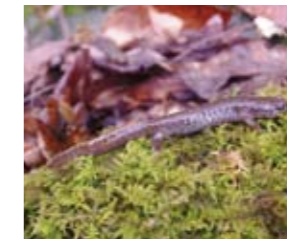
カスミサンショウウオ