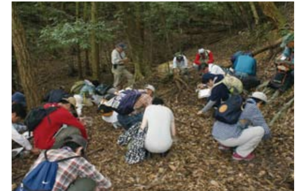
夏に行った自然観察指導員講習会。市内外から多くの人々が加西の自然を教材に自然の見かたを学習しました。