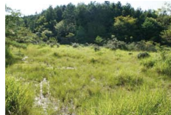
地域の手で保全活動が始まった県内最大級の湿地帯。県天然記念物候補の宝塚市丸山湿原以上との評価です。