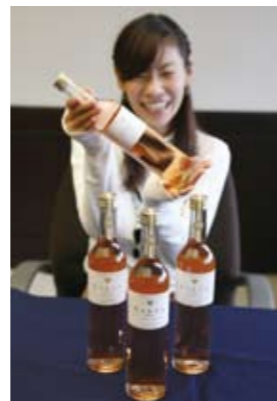
豊かな香りと柔らかな口当たりが特徴です。

【問合せ先】 農政課（農政係）☎④8741 FAX④1802 nosei@city.kasai.lg.jp