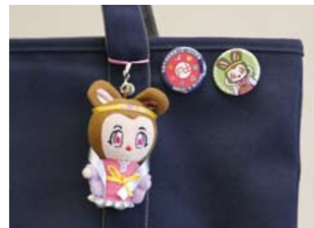
「ねっぴ〜ぬいぐるみ」と「風土記記念バッジ」

ねっぴ〜のぬいぐるみはストラップタイプで、大きさは 8 センチです。記念バッジは、ねっぴ〜と風土記事業のロゴマークを使った 2 つのデザインです。気軽にかばんや携帯電話につけることができます。また、お土産やプレゼントにもおすすめです。「ねっぴ〜」「風土記」でふるさと加西を盛り上げましょう。