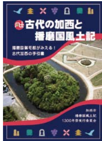
ガイドブックの表紙

加西市播磨国風土記 1300 年祭実行委員会は、古代のふるさとを知ることで、加西に対する愛着と誇りを育んでもらうため、加西市版播磨国風土記ガイド「古代の加西と播磨国風土記 - 播磨国賀毛郡がみえる！ 古代加西の手引書 -」（全 20 ページ、無料）を作成しました。