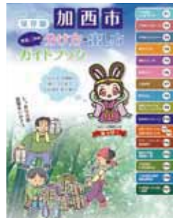
ごみ分別ガイドブック

広報かさい2月号(2月1日発行)といっしょに「加西市ごみ分別ガイドブック」を配布します。4月からのごみの分別・持ち込み方法を詳しく掲載していますので、ご覧ください。