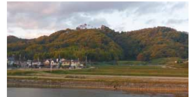
北条町小谷にある城山（標高 218 m）の頂上にある小谷城跡

参加者には記念品、温かいスープのサービスもあり、加西の豊かな自然と歴史を満喫しながらウォーキングをしましょう。