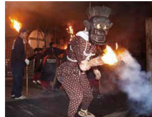
たいまつを振りかざして災厄を払います（鬼会）

「鬼会」は、たいまつを手に木槌を腰にさした赤鬼と鉾尾を手にした青鬼が境内の東西からそれぞれ 6 回お堂を縦横無尽に暴れ回り、悪霊や災難を追い払います。