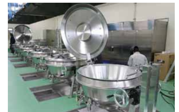
煮物・汁物などを調理する「ガス回転釜」