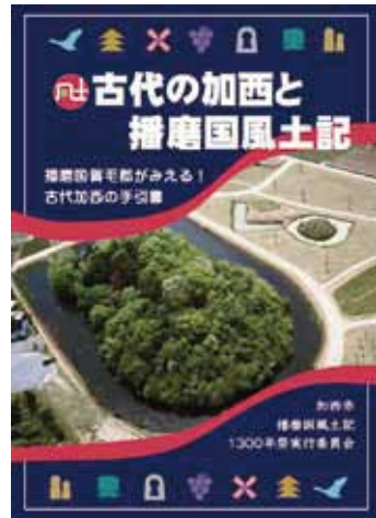
ガイドブックの表紙

加西市播磨国風土記 1300 年祭実行委員会は、古代のふるさとを知ることで、加西に対する愛着と誇りを育んでもらうため、加西市版播磨国風土記ガイド「古代の加西と播磨国風土記 ー播磨国賀毛郡がみえる！古代加西の手引書ー」（全 20 ページ、無料）を作成しました。