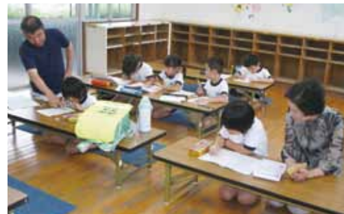
放課後学習の見守りの様子

同センターでは、地域のボランティアスタッフの皆さんによって、放課後の子どもたちの学習の見守りをはじめ、幼稚園での絵本の読み聞かせや子育て相談室「子育てほっとトーク」を開催し、地域で総合的に子育て支援をされていることが評価されました。