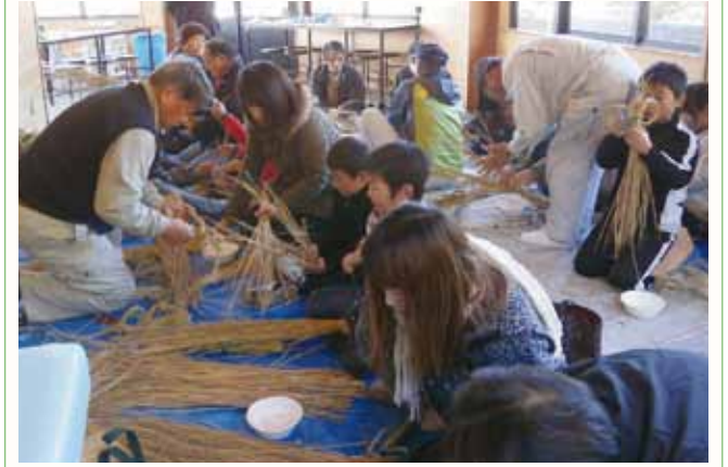
▲お正月を楽しみに、しめなわを作る参加者。

「しめなわづくり」教室が、丸山総合公園管理棟で開催され、親子連れら20人が参加しました。