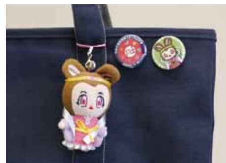
「ねっぴ〜ぬいぐるみ」と「風土記記念バッジ」

ねっぴ〜のぬいぐるみはストラップタイプで、大きさは 8 センチです。記念バッジは、ねっぴ〜と風土記事業のロゴマークを使った 2 つのデザインです。気軽にかばんや携帯電話につけることができます。また、お土産やプレゼントにもおすすめです。「ねっぴ〜」「風土記」でふるさと加西を盛り上げましょう。