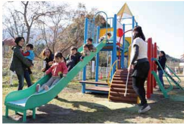
▲善防公民館の遊具で遊ぶ子どもたち。

昨年4月に廃園になった田原保育園と旧日吉保育園にあった遊具を修繕し、善防公民館とオークタウン加西に移設しました。