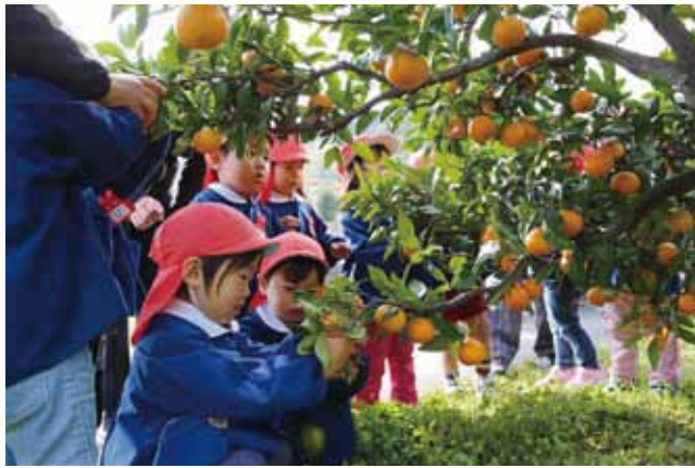
▲たくさんのみかんに大喜びの園児。

泉第一保育所と泉幼稚園の園児72人が、シルバーロイ株式会社（大内町）の招待で、同社敷地内の畑でみかん狩りをしました。