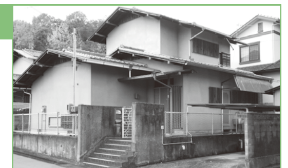
木造瓦葺2階建・建物面積103.61㎡・築549年

入札関係の資料は、1月6日以降に加西病院用度管理課での配布または病院ホームページからダウンロードしてください。また、1月6日付で市役所掲示板に告示します。