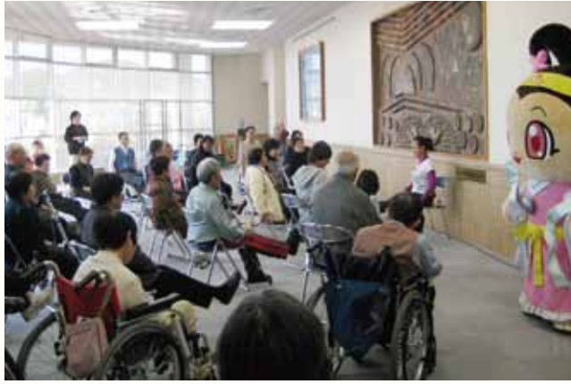
▲足に負担をかけることなく、気軽にできる健康体操。

健康増進センターと市健康課を移転した健康福祉会館で、6年ぶりに「健康福祉まつり」を開催しました。