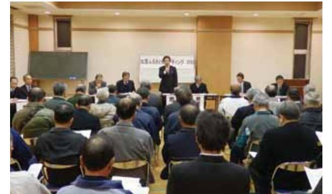
賀茂地区のタウンミーティング(平成25年11月14日、賀茂会館)

各会場でお聴きしたご提案やご意見については、今後の市政に可能な限り反映させていきます。