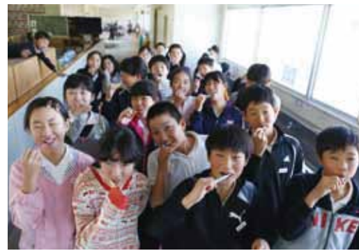
給食後に歯磨きをする 6 年生

結果、当初（平成 22 年 4 月）は歯磨きをしていた児童が 65% でしたが、今では 93% の児童が歯磨きをするようになりました。