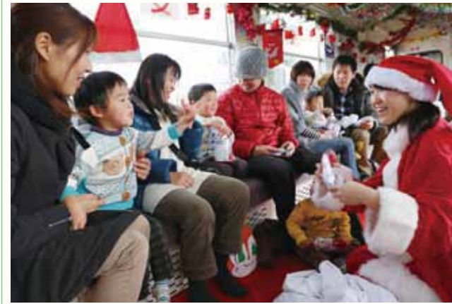
▲サンタさんからクリスマスプレゼントを受け取る子どもたち。

北条鉄道は12月4日から23日まで、大人気の「サンタ列車」を運行。列車は、片道13.6kmある北条町駅と粟生駅を往復しました。