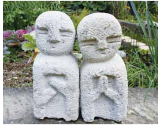
ミニ石仏 高さ30cm・幅10cm。ノミと金槌を使って石を彫り、制作します。

【申込・問合せ先】 商工観光課(観光振興係) ☎428740 FAX431802 shokokanko@city.kasai.lg.jp