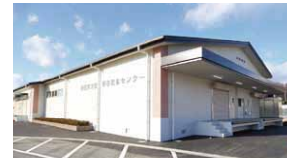
一日最大2000食の調理能力のある「北部学校給食センター」