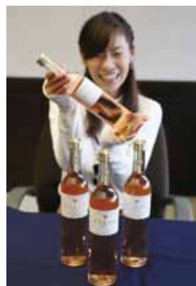
豊かな香りと柔らかな口当たりが特徴です。

■販売店／市内酒販店、かさい愛菜館、いこいの村はりま、コープ加西、イオンモール加西北条など