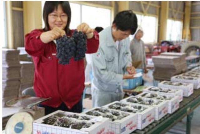
▲岸呂町の集荷施設での出荷作業。

加西市特産のブドウ「加西ゴールデンベリー A」の出荷が始まりました。市内の約130軒の農家が生産しています。