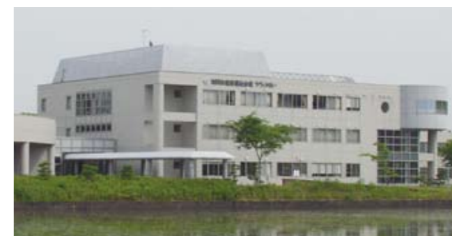
健康福祉会館(加西市北条町古坂)

(注) 市外医療機関での接種予定者のみ事前申請が必要です。受付開始は10月1日予定。