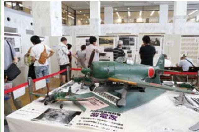
▲戦闘機「紫電改」の模型展示。

鶉野平和祈念の碑苑保存会は8月1日から31日の間、アステシアかさいで「鶉野飛行場展」を開催しました。