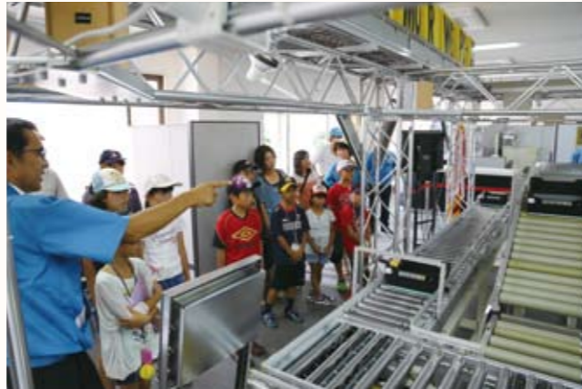
▲消費電力も少なく、最大1トンの重量物を搬送できるパワーモータ（伊東電機が開発）を使用したローラーコンベヤ。

加西商工会議所は、地元企業への興味・関心を高めて、将来の就職活動に役立ててもらおうと、7月26日と8月9日に「夏休み産業・観光ツアー」を開催しました。