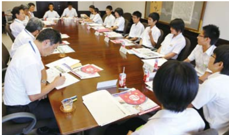
4 中学校の生徒代表が市長らと意見交換