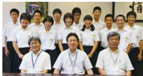
中学生12人と市長(中央)、副市長(右)、教育長(左)

市内4中学校の生徒会長や副会長ら12人が、学校の現状と課題、中学生目線から気づいた加西市への要望等について意見交換しました。中学生の主な意見・感想は次のとおりです。市は、これらの意見を検討し、予算や施策に反映させていきます。