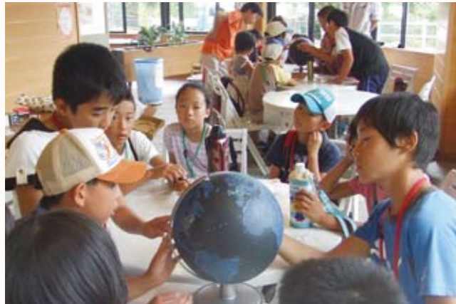
▲「夜の地球儀」から、世界各地の光エネルギーの使用量で、明るく輝く都市を観察する子どもたち。

丸山公園管理棟で、夏のわくわく科学実験『電気で遊び、電気で学ぶ』が開催され、小学生19人が参加しました。