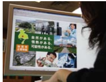
掲載している企業は、平成26年4月に採用を予定している22社。

加西市に数多くあるモノづくりをはじめとする優良な企業や、高度な技術力で活躍する企業の採用情報を、より多くの大学生に発信するため、平成24年12月からインターネットの就職情報サイト（日経就職ナビ）に市内企業の採用情報の掲載を開始しました。