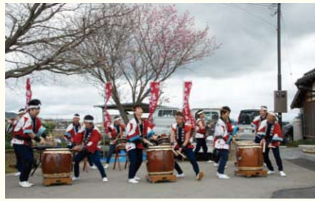
▲播州加西あばれ太鼓のメンバーが力強い太鼓を披露（法華口駅）。