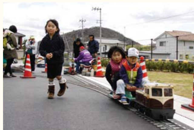
▲子どもに大人気のミニ鉄道（網引駅）。

北条鉄道は、沿線の桜を楽しんでもらおうと、北条町駅などで「さくらまつり」を行いました。