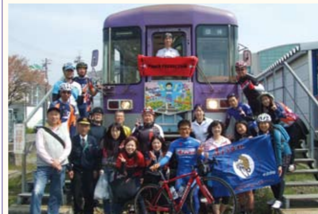
▲サイクリングを楽しみ、中島選手と交流を深めた参加者。

自転車競技選手の中島康晴選手（愛三工業レーシングチーム）と行く「おいしさと鉄道の旅」が行われました。