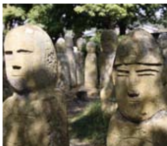
親や子に似た顔があるとされている五百羅漢石仏

NHK「新 兵庫史を歩く」は県内の隠れた名所・旧跡・歴史を講師の歴史家とともに訪ねて歩く、視聴者参加型の紀行番組です。