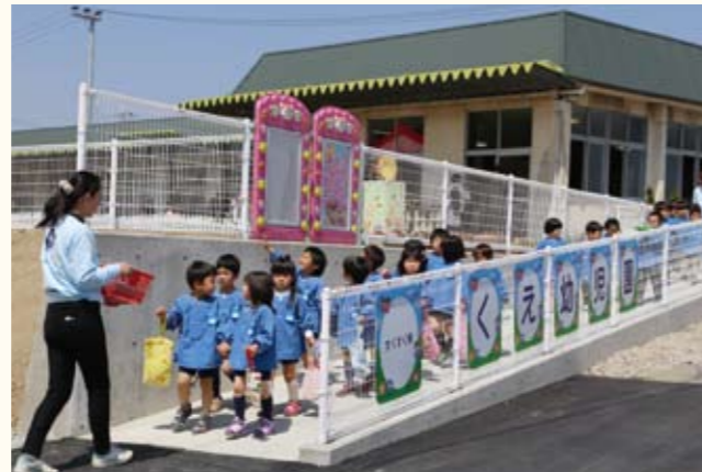
▲九会幼児園に、胸を躍らせて登園する園児。

昭和32年に開園して以来、56年の歴史のある田原保育園で、閉園式が行われました。