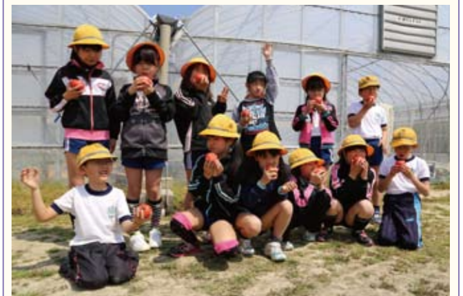
▲「家で食べるのと甘さが全く違う」とトマトを試食する宇仁小学校の児童。

九会・富合・宇仁小学校の3年生が、社会見学の一環として、それぞれの小学校区にあるトマト農園を訪れました。