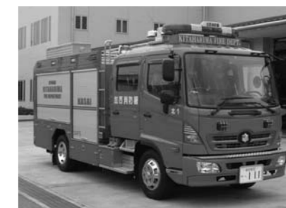
災害対応特殊消防ポンプ自動車

高い消火能力を有するCAFS装置（水と消火薬剤の混合液に圧縮空気を圧入し生成された泡を放射する装置）を搭載。緊急消防援助隊の消火部隊として登録し、大規模災害時には広域応援出動します。