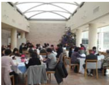
プロフィールを見ながら、お目当ての相手を探す参加者。

平成24年12月9日にフラワーセンター内のレストハウス「フルーリ」で、独身者の親同士（独身男性の親20人、独身女性の親19人）が、子どもに代わって、お見合いをするイベントを開催しました。