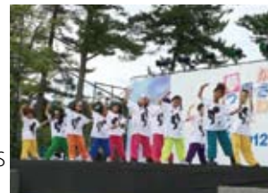
昨年ダンスを披露したADS キッズダンスグループ