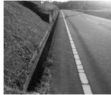
歩道が無く路肩も狭い（市道油谷1号線）。