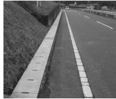
側溝に蓋掛けをして、路肩を拡幅しました。