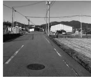
歩道が無く路肩も狭い。白線も消えかかっている（市道河内野上線）。