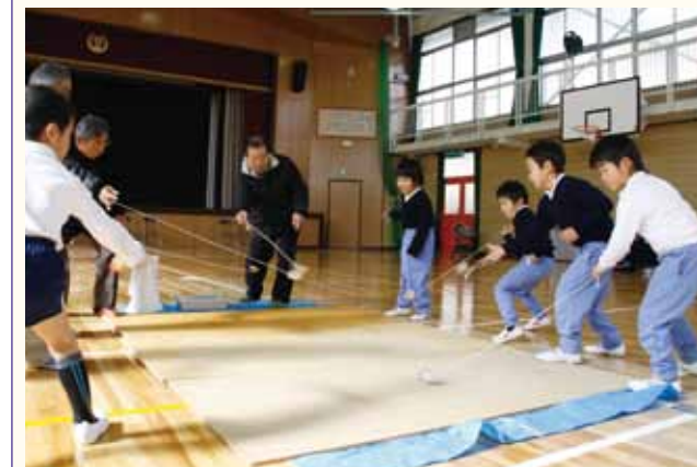
▲こま回しで、おじいちゃんや誰が一番長く回るかを勝負する児童。

日吉小学校の1年生23人が、祖父母15人からこま回しやお手玉など、7種類の昔の遊びを教わりました。