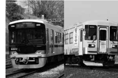
神戸電鉄粟生線 北条鉄道

これは、同内容の神戸電鉄粟生線活性化協議会「粟生線通勤Come Back補助制度」とあわせて実施するものです。