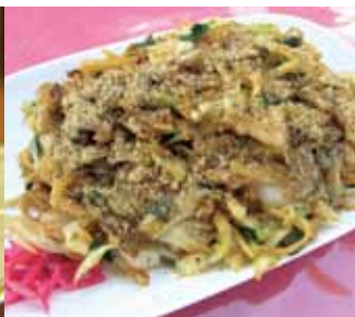
麺にコシがあり、硬めの食感が特徴の「富士宮やきそば」

加西市のご当地ハンバーガー「へらへとバーガー」や播州地域の人気グルメをはじめ、全国的に有名な富士宮やきそば、津山ホルモンうどんなど、人気のご当地グルメがアステリアかさいの屋上に登場します。