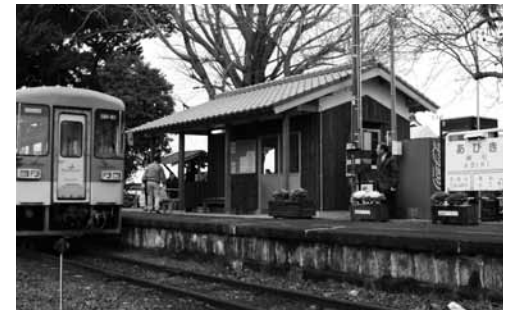
木造平屋約15㎡。室内には旧駅舎の写真や北条鉄道の行事案内などが並んでいます。

この度、法華口駅トイレをはじめとする沿線企業と住民による駅整備の一環として、約100人のボランティアと寄付者の協力で、29年ぶりに駅舎が復活しました。