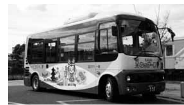
市街地などを走るコミバスのねっぴ〜号