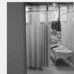
小児科外来診療室

これらの流れから、少数医師が勤務する中小病院の小児科を維持するのが困難になってきました。制度的な流れに抗して、加西病院のような小さな規模の小児科に医師を確保するためには、医師個人が