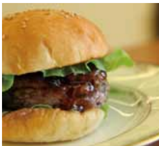
加西市の食材をふんだんに使用した「へらへとバーガー」