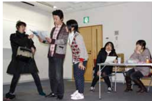
一人でも多くの人の心に響くようにと、練習を重ねるメンバー

それらを思い出し、家族のあたたかさ、大切さを改めて感じてもらいたいという願いを込めた公演です。