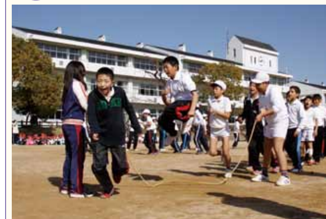
▲高学年の部で優勝した5年1組は、248回跳びました。

北条小学校で長縄跳び大会が行われ、全児童420人が体力向上と協力して取り組むことの大切さを学びました。