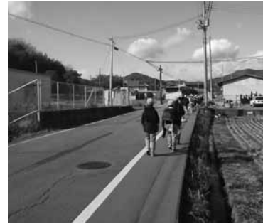
中央線を消し、路肩の幅を広げて外側線を引き直しました。路肩は緑色に着色し、通学路を確保しました。