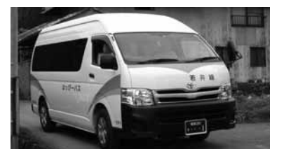
主に西在田地区を走るはっぴーバス