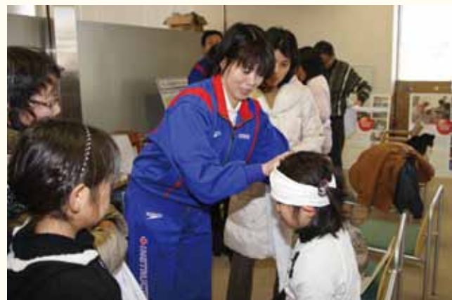
▲日本赤十字社兵庫県支部・加西市地区の会員が指導する応急手当体験コーナー。

「ひとりの手みんなでつなげば加西のちから」をテーマに、「第14回ボランティアのつどい」が健康福祉会館で開催され、約700人が参加しました。