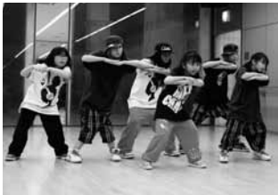
講師を務めるキッズダンサー

7月14日に健康福祉会館で開催される「ユニバーサルイベント KAFE2013」の出演を目標に、小学生から大学生まで幅広い年代のボランティアダンサーが指導します。参加希望者は、3月29日(20:00～21:00)にアステアかさいで行われる「体験教室&保護者説明会」を受講してください。