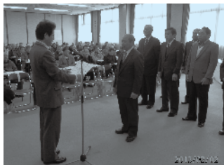
西村市長から表彰

2月2日、市民会館で開催しました「区長会・農会長会」で、明るく住みよい地域社会づくりのため、地区代表の区長、農会長を務められた方、また、区長、農会長を4年以上務められた方で、このたび退任された方に「市長感謝状」をお贈りしました。