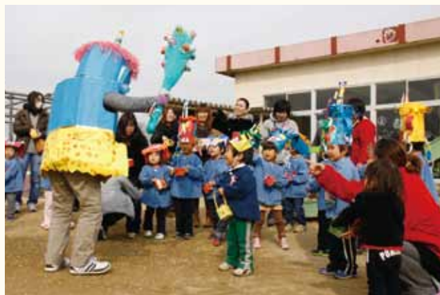
▲鬼にびっくりしたり、泣いたりする園児もいましたが、必死で鬼を追い払いました。