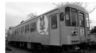
ねっぴ〜の描かれた北条鉄道の車両