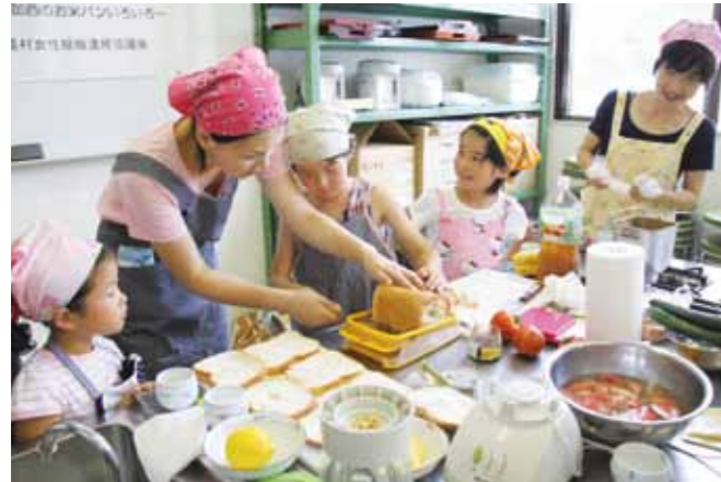
▲できたてのお米パンをお母さんに手伝ってもらいながら切る子ども

加西市農村女性組織連絡協議会が主催する、親子料理教室が7月25日に南部公民館で行われ、親子10組23人が参加しました。