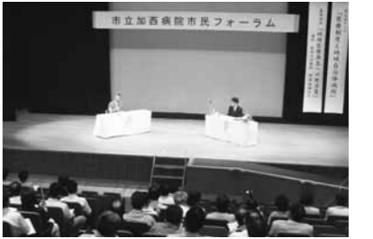
前回の加西病院市民フォーラム

日時：9/27(木)19:00～20:30 開場18:30 場所：健康福祉会館大ホール 問合先：加西病院総務課☎2200