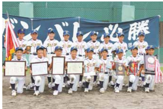
▲優勝した泉少年野球クラブのメンバー

県内の頂点を決める「第22回県選抜都市対抗少年野球大会」が8月12日からの3日間、アラジンスタジアムなどで開催され、泉少年野球クラブが初優勝しました。富田少年野球団は3位と健闘しました。