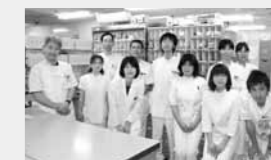
薬剤部のメンバー

たが、10月からは、病院を出た後に調剤薬局に行かなければなりません。処方せんの有効期限は4日間です。