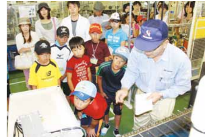
▲㈱千石で、「グラフアイトヒーター」の製作過程を見学する参加者

加西商工会議所は、地元企業に興味・関心を高めて、将来の就職活動に役立ててもらおうと7月27日、「夏休み産業・観光ツアー in かさい」を開催しました。