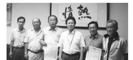
認定農業者として認定された2法人

2法人は認定農業者として認定され、今後、加西市農業者の代表として、効率的かつ安定的な農業経営をめざします。