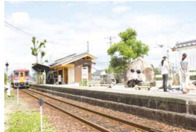
▲整備されたトイレ（中央左）と石庭

100人を超えるボランティアと寄付者の協力で、北条鉄道・播磨下里駅が生まれ変わりました。