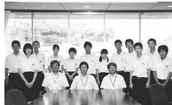
中学生12人と市長（中央）、副市長（左）、教育長（右）