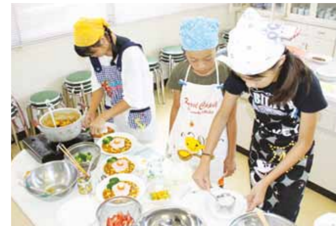
▲カラフルに彩ったカレーを作る参加者

8月20日、善防公民館は加西産の野菜を使った、オリジナルのカレー作りに挑戦する「カレー選手権」を開催、小中高生の8チーム28人が参加しました。