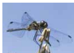
マダラナニワトンボ