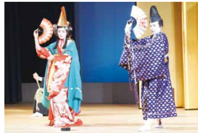
▲雅やかな舞で観客を魅了する、県立播磨農高の郷土伝統文化継承クラブによる播州歌舞伎「寿式三番叟」

県下各地の民俗芸能団体が芸能を披露する「ひょうご民俗芸能祭ⅠNかさい」が8月5日、市民会館文化ホールで開催されました。