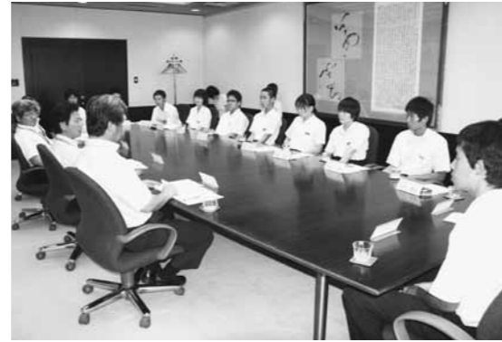
4中学校の生徒代表が市長らと意見交換