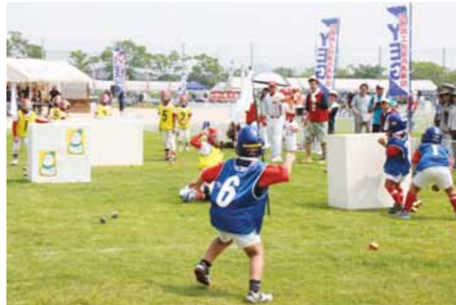
▲相手チームの選手めがけて雪玉を全力で投げる参加者（ジュニアの部）

加西商工会議所主催の「第7回真夏の雪合戦」が7月29日、伊東電機丸山グラウンドで開催されました。