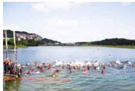
善防山(左奥)をバックに、ため池を水泳でスタートする第1回大会の選手

【問合せ】 グリーンパークトライアスロンin加西実行委員会事務局・商工観光課 ☎④8740