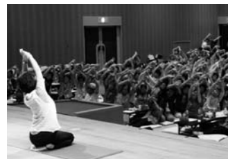
昨年の健康ミニ体操