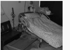
家族と共に出産を迎えられる分娩室