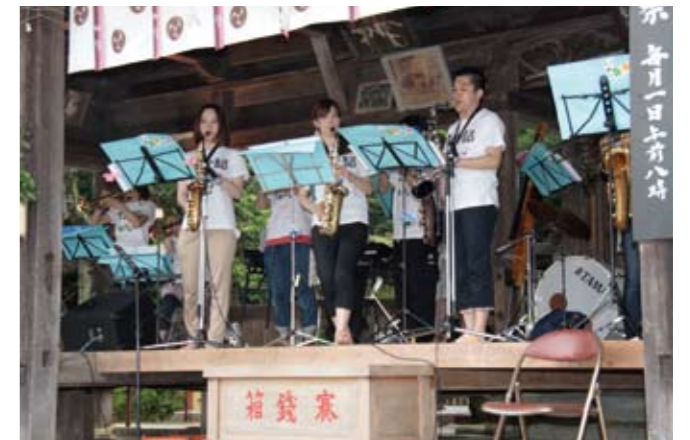
▲ジャズビッグバンド・スガ部の演奏。来場者からの 100 円募金で、会場から被災地へ支援物資なども送りました。

東日本大震災の被災者を支援しようと、NPO 法人 MORE 地球家族が 7 月 21 日、第 3 回復興支援イベント「ハチドリまつり」を日吉神社（池上町）で開催しました。