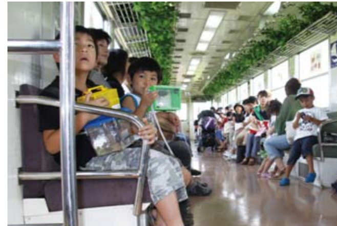
▲かぶと虫と列車の旅を楽しむ子どもたち

北条鉄道は 7 月 21・22 日、「かぶと虫列車」計 8 便を運行し、親子連れら約 500 人が列車の小旅行を楽しみました。