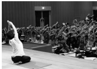
昨年の健康ミニ体操