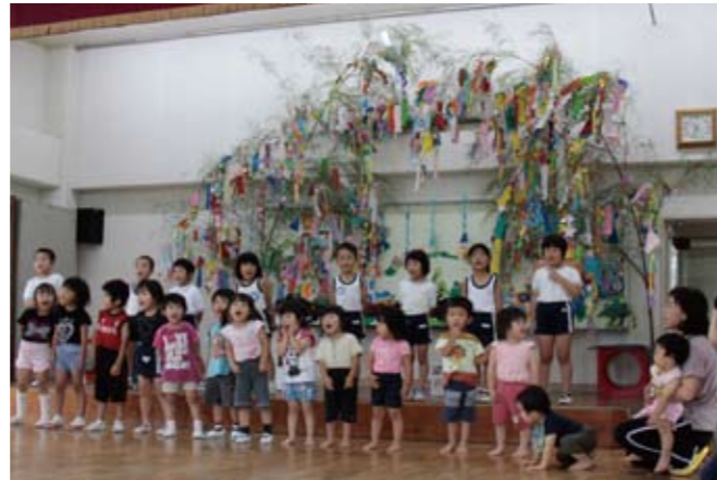
▲飾り付けた笹の前で、七夕祭りの歌をうたう園児

宇仁幼稚園で 7 月 6 日、「七夕会」が行われました。園児 30 人は、七夕祭りの歌をうたったり、七夕の話しを聞いたりしました。前日には親子で、笹に短冊や提灯などの飾り付けを行いました。