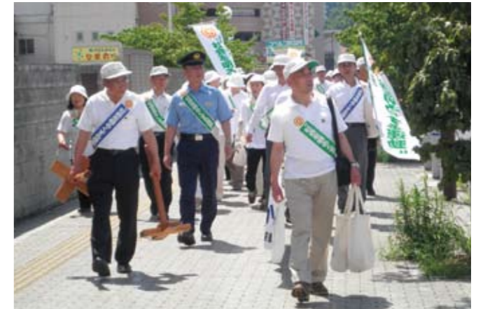
▲アスティアかさい、イオンモール加西北条、市役所で啓発活動を行う、社会を明るくする運動・加西市推進委員会の皆さん。

犯罪や非行をなくし、あやまちからの立ち直りを支える地域をつくろうと、北播保護司会（吉田公明・加西分区長）や更生保護女性会、警察、市などは 7 月 2 日、社会を明るくする運動を行いました。