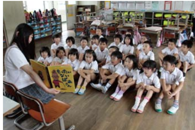
▲本に興味を持ってもらおうと読み聞かせをする北条高校生

北条高校生 20 人が 7 月 12 日、本に親しんでもらおうと、富田小学校の児童計 144 人に絵本や紙芝居の読み聞かせをしました。