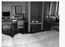
家族も泊まれる病室