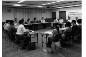
在田地区のタウンミーティング