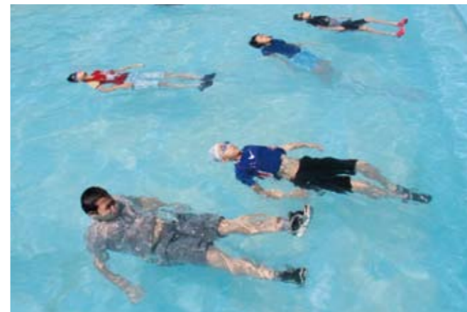
▲着衣のままプールに入った児童は泳ぎにくさを実感。「浮いたまま助けを待ちましょう」と教わりました。

万が一溺れてしまった時のために、宇仁小学校で 7 月 18 日、全児童約 80 人が着衣水泳訓練を行いました。