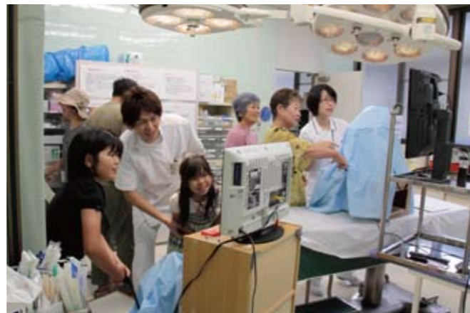
▲腹腔鏡手術の疑似体験。実際の手術で使用する器具を使い、モニター画面を見ながら、箱の中にあるお菓子をつかむ参加者。

地域に根ざした病院をめざして、市立加西病院は 7 月 7 日、「第 9 回ホスピタルフェア」を開催、市民ら約 300 人と病院職員がふれあいました。