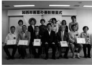
かしの木賞・サルビア賞を受賞された皆さん

「かしの木賞」は、市木かしの木の一本のたくましさの象徴として個人に、「サルビア賞」は市花サルビアの群生の集団美をたたえる意味で団体にお贈りするものです。